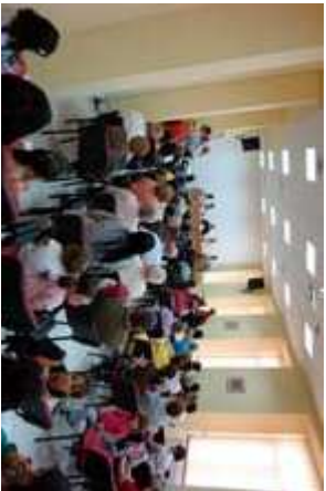
■ Figura 9. Participación. Sesión informativa con los vecinos de la UVA organizada por el Ayuntamiento.