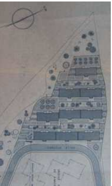
■ Figura 5. Extracto del proyecto de los bloques de la OSH redactado por Rafael Arévalo en 1968. El retranqueo del segundo bloque no llegó a realizarse.

En 1967 se redacta el proyecto de las obras de los bloques al oeste de la UVA que completan el conjunto. Son llevadas a cabo por la OSH en 1970 y dirigidas igualmente por Arévalo (Figura 5).