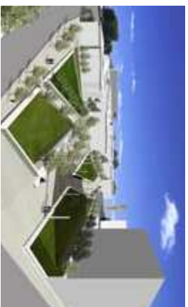
■ Figura 12. Imagen renderizada del proyecto. Nuevas conexiones peatonales.