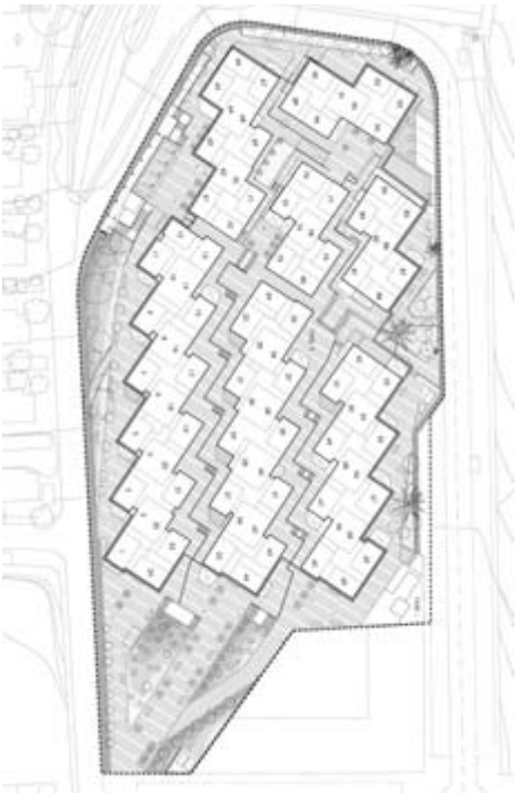
■ Figura 11. Proyecto de Rehabilitación Urbana. Puede apreciarse la continuidad viaria con el PERI Los Cuarteles al Norte. La propuesta de rehabilitación de las plazas interiores, así como el proyecto definitivo del nuevo acceso.