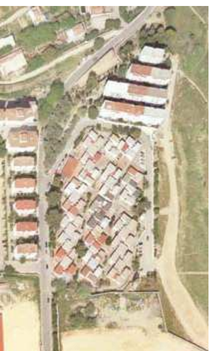
■ Figura 3. Estado actual de la Barriada de la Paz de San Roque. Puede apreciarse el muro que limita su conexión con el núcleo urbano al Este y el viario en fondo de saco que potencia su condición aislada. En el centro de la imagen el conjunto UVA de 96 albergues provisionales. Al Oeste los cuatro bloques posteriores que completan la barriada con 72 viviendas llevadas a cabo por la OSH. Foto aérea 2006.

Las unidades de una y dos plantas de altura, configuran una interesante ordenación con un sistema de agrupación girada que permite generar una sucesión de patios y espacios públicos peatonales.