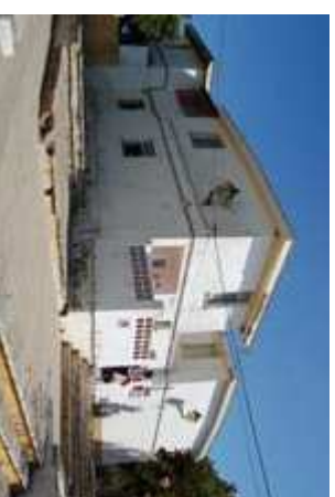
■ Figura 8. Interior de la barriada. Diciembre 2008.