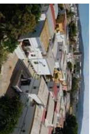
■ Figura 7. Imagen general de la barriada con los Cuarteles, la ermita y el Conjunto Histórico de San Roque al fondo. Diciembre 2008.