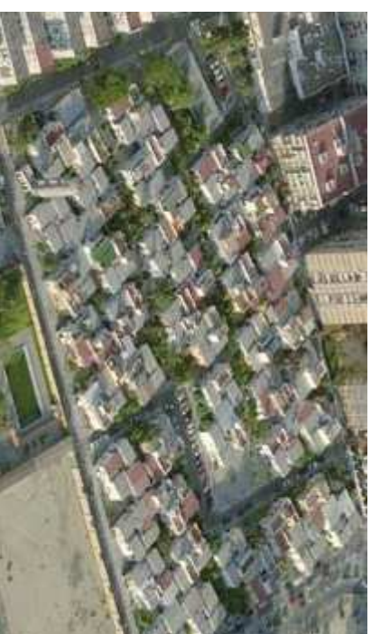
■ Figura 4. San Juan de Aznalfarache. Conjunto de viviendas en San Juan Alto. Puede apreciarse la idéntica disposición tipológica, transcripción literal del modelo que llega incluso al idéntico diseño de los depósitos de agua.

En este caso, y debido a la acusada pendiente Norte-Sur se resuelve mediante tres plataformas conectadas por escaleras que recorren todo el ámbito. La transcripción del modelo se lleva a cabo de manera literal de unos emplazamientos a otros (Figura 4).