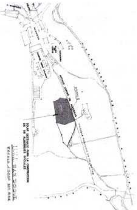
■ Figura 2. Situación del futuro Proyecto en el antiguo camino de Algericras. Sombreado el solar destinado para la construcción de los 96 albergues sociales.