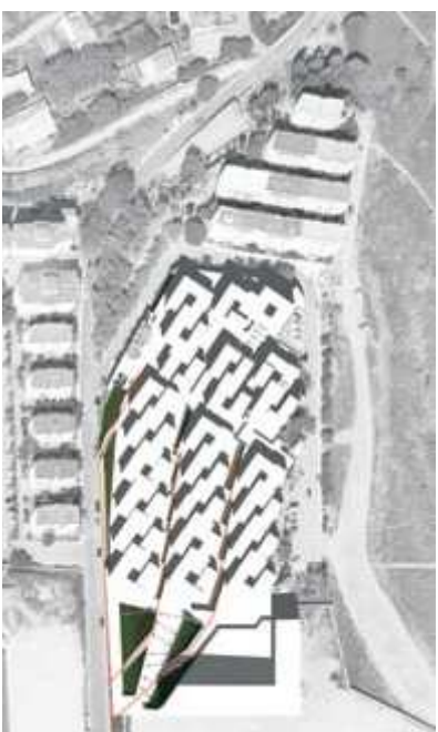
■ Figura 10. Anteproyecto. Se detecta la posibilidad de incorporar una parcela municipal destinada a infraestructuras como elemento de conexión con la calle ermita.