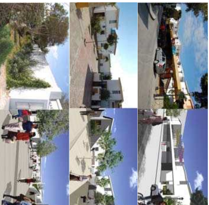
■ Figura 13. Imágenes del proyecto.