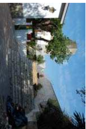
■ Figura 6. Imagen del muro perimetral al Este de la barriada, límite físico y social. Al fondo el Depósito del Agua. Diciembre 2008.

A partir de las encuestas realizadas, se realizaron sesiones informativas para recabar las necesidades de los vecinos que se convertirían de modo indirecto en redactores del documento. La participación se convierte en una pieza clave para que la propuesta de rehabilitación realmente se centre en las necesidades del vecindario (Figura 9).