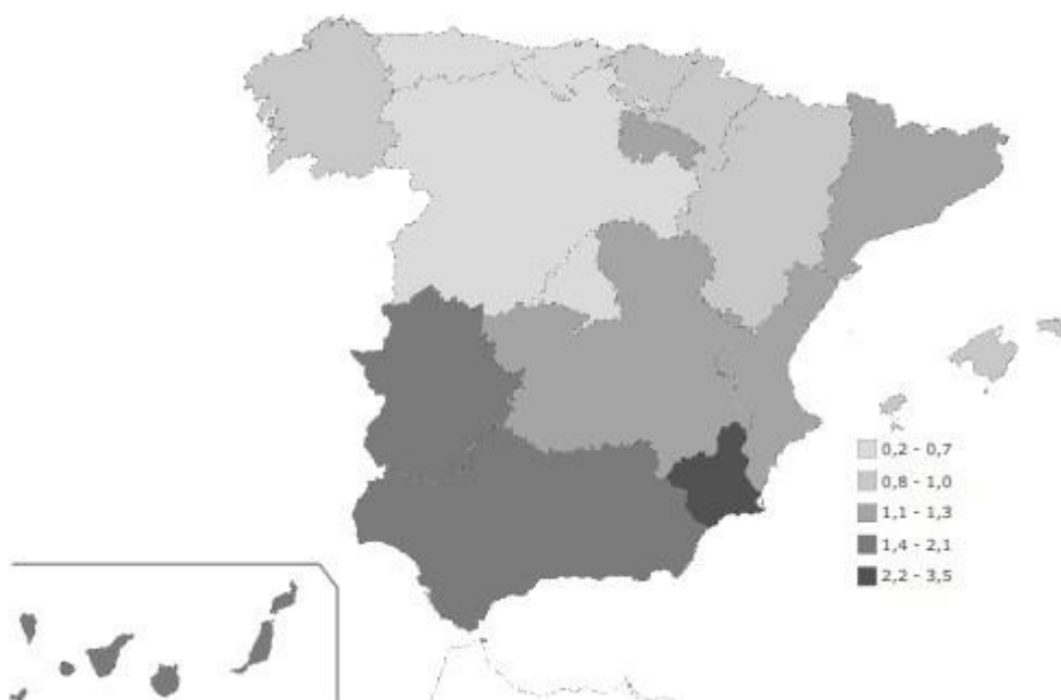
Mapa 3: Porcentaje de población analfabeta con respecto del total en cada Comunidad Autónoma en el primer trimestre del año 2023 (porcentajes).