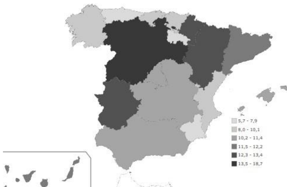
Mapa 5: Porcentaje de población con educación primaria con respecto del total de cada Comunidad Autónoma en el primer trimestre del año 2023 (porcentajes).