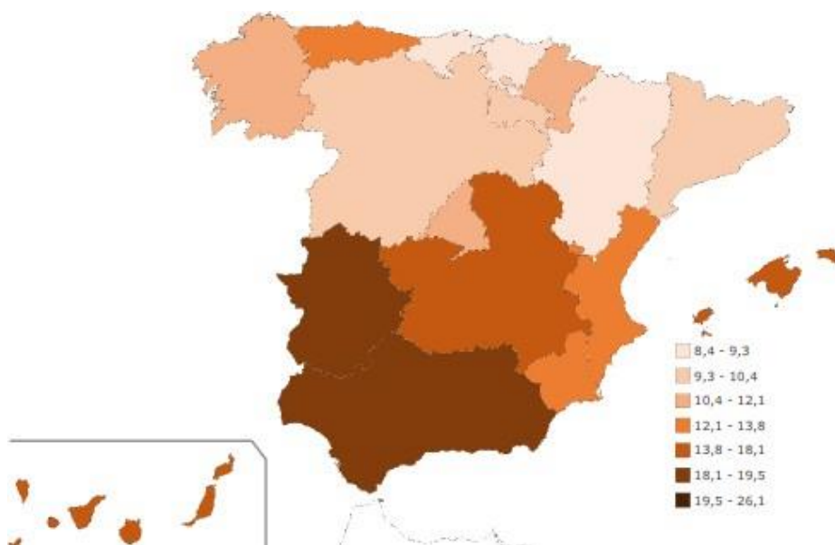
Mapa 2: Comparación de las tasas de paro por Comunidades Autónomas en España en el primer trimestre del año 2023 (Tasas)