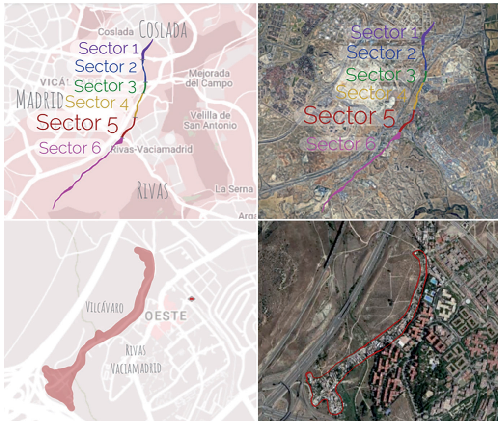
Fig.1. Localización y recorrido del Sector V, el cual discurre entre el distrito madrileño de Vicálvaro y la urbanización de Covibar de Rivas-VaciaMadrid.

de desalojo ha comenzado el debate continúa, agravado ante los frecuentes cortes de suministro eléctrico que se suceden en el asentamiento desde el año 2021, los cuales constituyen “un retroceso en el bienestar de las personas pobladoras y están influyendo en el acceso a otros derechos y en las relaciones sociales” (Dirección General 2022, 79).