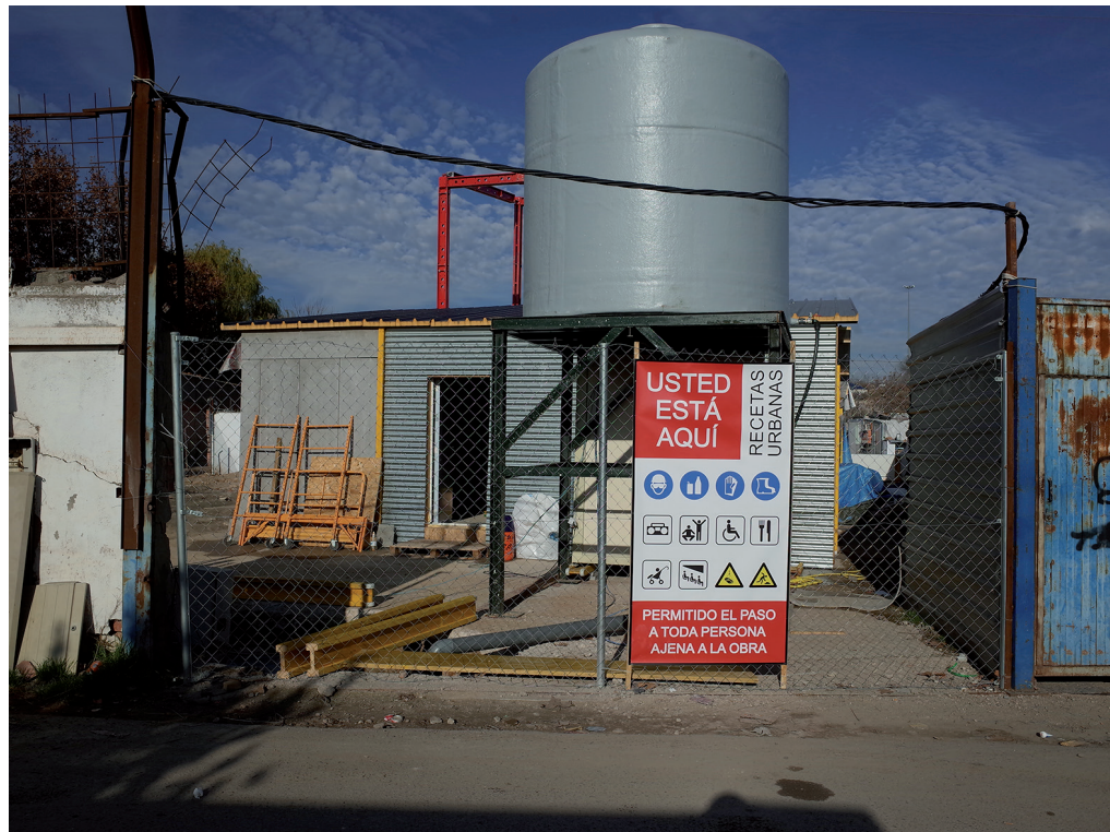
Fig. 5. Fotografía del cartel instalado en el acceso del recinto de obra, en la parcela 37B. Recetas Urbanas.

en las inmediaciones del asentamiento –C.E.M. Hipatia, Centro penitenciario de Soto del Real, Taller Iroko y E.S.D. de Madrid–, en los cuales se organizaron los talleres de prefabricación de cuatro de los cinco módulos 19 que conforman el centro, los cuales fueron ensamblados in situ .