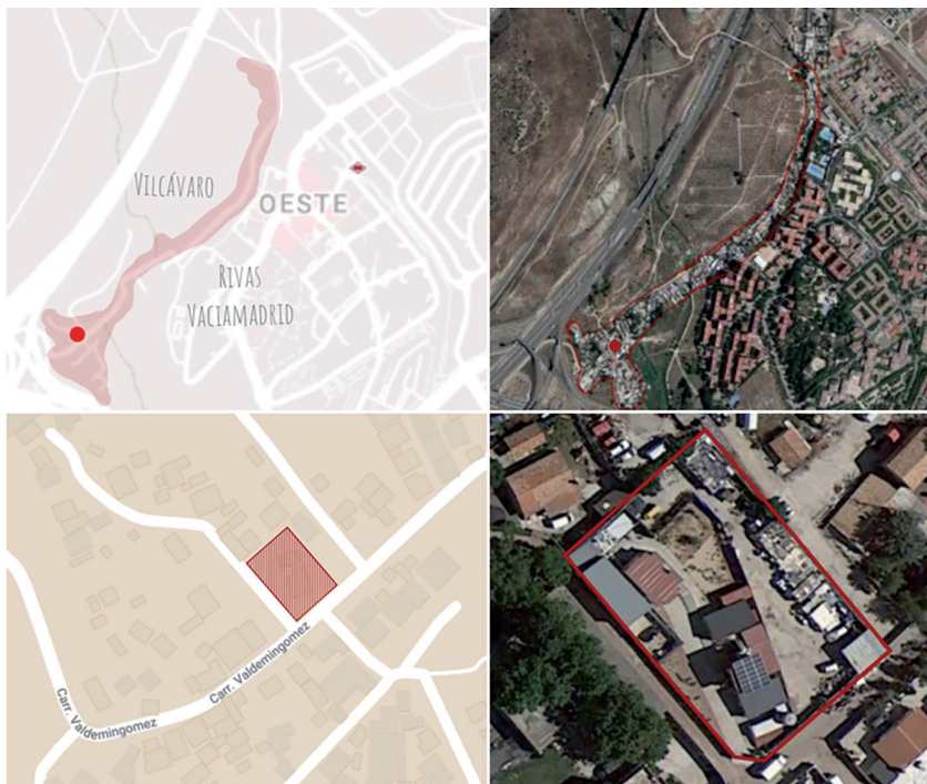
Fig. 2. Localización de la parcela 37B –Carretera de Valdemingomez– dentro del Sector V.

Su origen se remonta a la creación, durante la alcaldía de Manuela Carmena (Madrid 2015-19), de los Fondos para el Reequilibrio Territorial que supusieron el inicio de las conversaciones entre el Área de Coordinación Territorial y Cooperación Público-Social y las entidades sociales y asociaciones vecinales del asentamiento, y cuyo culmen fue la creación, en el año 2016, del Comisionado de la Cañada Real para la mediación y la coordinación de las acciones conjuntas (Fanjul 2019; Núñez Martí y Goycoolea Prado 2019, 786). Una acción que, combinada con la conformación del Pacto Regional por la Cañada Real Galiana (17 de mayo de 2017) posibilitó la creación del primer centro social público del Sector V. La necesidad de este espacio fue advertida por las asociaciones vecinales y la comunidad durante las reuniones convocadas por la administración (Redacción La Vanguardia 2019), en las que la población no reclamó “un espacio para consumir actividades sociocomunitarias, sino un espacio que ellos querían producir y un espacio donde producir también actividad sociocomunitaria” (Pelegriña 2021, sc. 6:42). El proceso desembocó en la convocatoria, en tres ocasiones –dos declaradas desiertas–, de la licitación pública 10 , finalmente adjudicada a Recetas Urbanas , quien concurrió en el concurso asociado con RH Estructuras 11 .