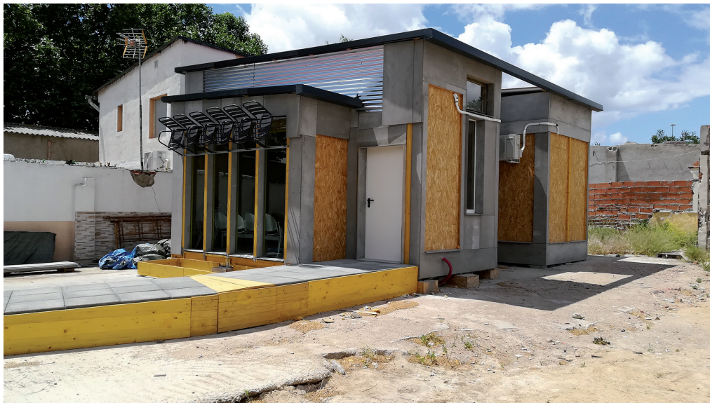
Fig. 6. Fotografía del exterior de la sala de usos múltiples, donde se aprecia la reutilización de sillas como parasol.