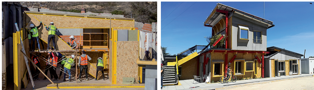
Fig 4. Contraposición del proceso de construcción comunitaria (noviembre 2018-marzo 2019) y la edificación, en la cual observamos la reutilización de estructuras y materiales, como las ventanas, de perfiles dispares. Recetas Urbanas.

las cuales, afirma, perseguía “que ese proyecto realmente fuese un centro comunitario desde el principio, desde su germen y su construcción” (Arrojo-Naveira 2021, 81).