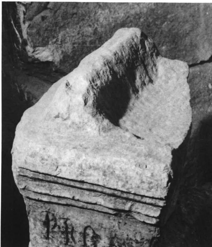
LÁMINA VIII. Fragmento de ara (nº 4) Coronamiento

Está realizado en mármol blanco, y presenta unas dimensiones conservadas de 0,26m. x 0,20m. x 0,25m. Conserva el pulvino derecho, con balteus central, cuer-