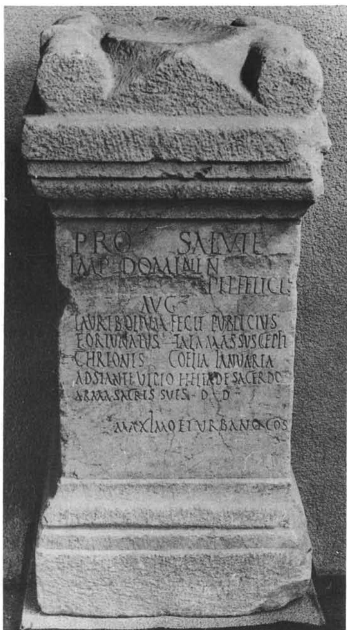
LÁMINA III. Ara taurobólica del 234 d.C. (nº 1) (Museo Arqueológico de Córdoba)