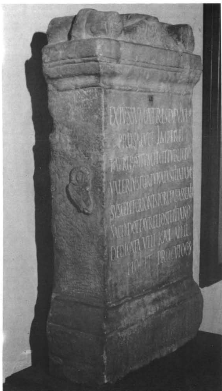
LÁMINA VII. Ara taurobólica del 238 d.C. Lateral