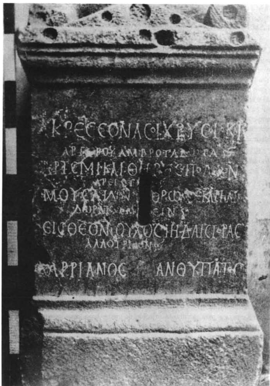
LÁMINA I. Ara de Arriano (Museo Arqueológico de Córdoba)