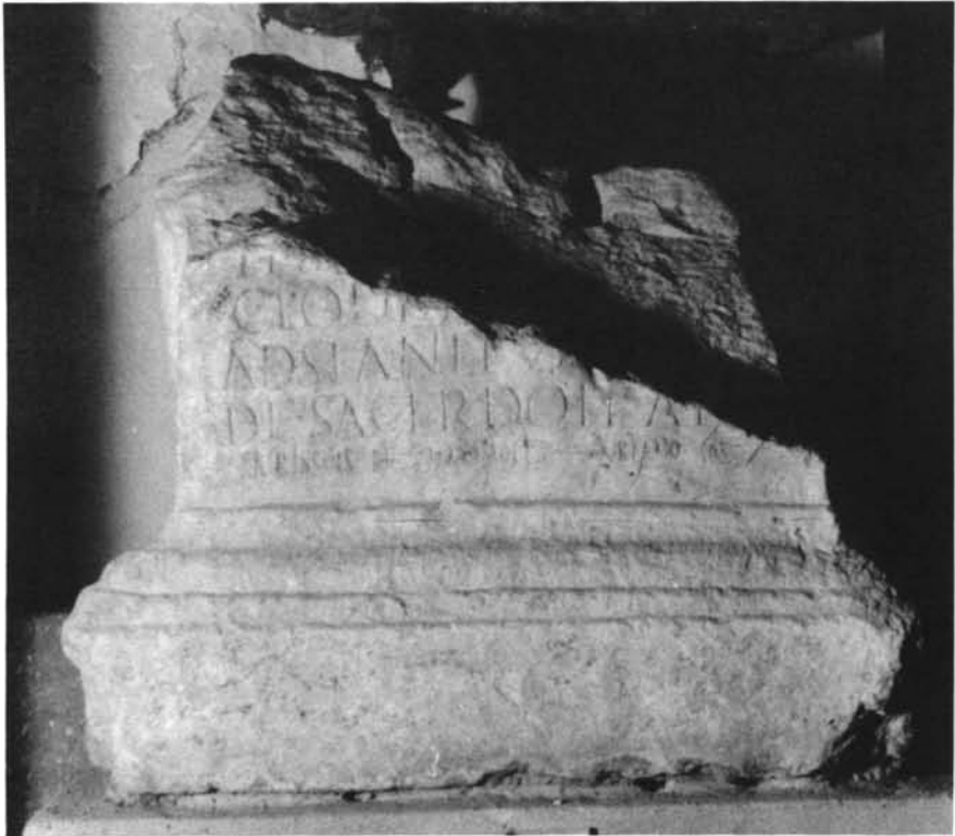
LÁMINA V. Fragmento de ara taurobólica (nº 2) (Museo Arqueológico de Córdoba)

2) En las mismas circunstancias que la anterior, apareció el fragmento inferior de otro altar dedicado a Cibeles, que conmemora asimismo la realización de otro taurobolium que fue realizado por el mismo sacerdote que en el caso anterior, Vlpus Helias 37 . Está elaborada en idéntico material (mármol blanco de las cante-