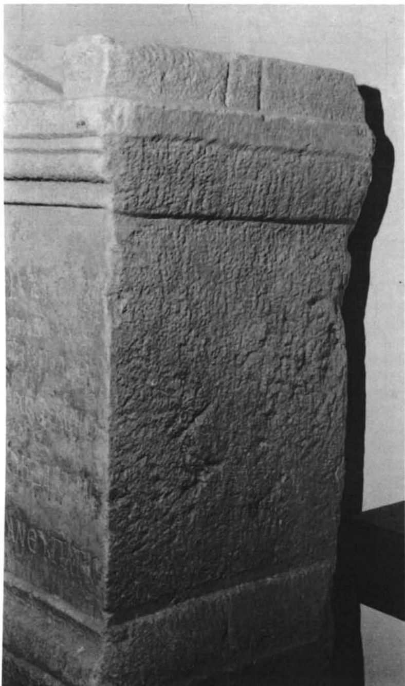
LÁMINA II.-2. Ara de Arriano (Museo Arqueológico de Córdoba)