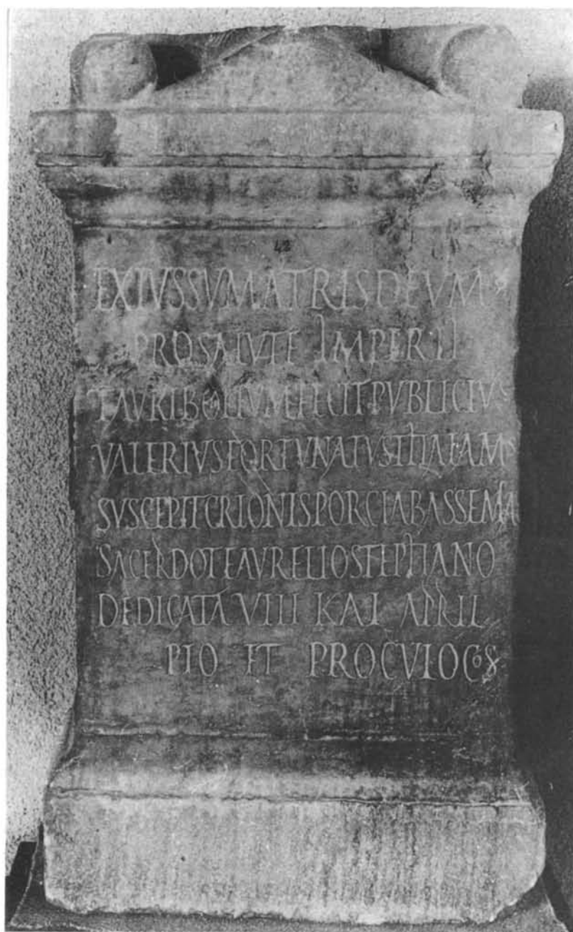
LÁMINA VI. Ara taurobólica del 238 d.C. (nº 3) (Museo Arqueológico de Córdoba)