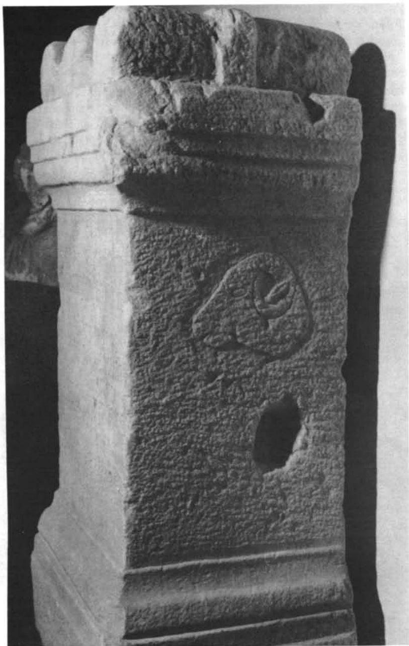
LÁMINA IV. Ara taurobólica del 234 d.C. Lateral