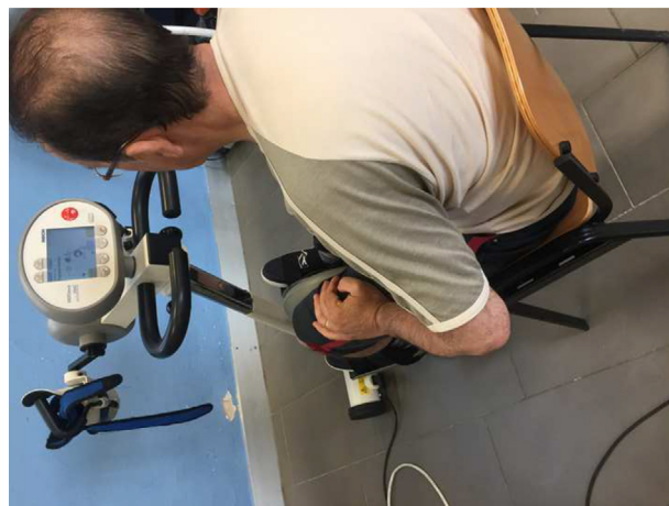
Figura 1 Sistema MOTOMed Viva2 Movement Trainer®.

Los criterios de inclusión fueron: 1) paciente derivado por un neurólogo de la Unidad de Esclerosis Múltiple del Hospital Universitario Virgen Macarena; 2) diagnóstico confirmado de EM con 2 años de antigüedad basado en los criterios de McDonalds; 3) EDSS establecida por un neurólogo \leq 7 ; 4) edad comprendida entre 20 y 70 años; 5) estabilidad médica durante los 3 meses antes del reclutamiento para el estudio; 6) ausencia de daños cognitivos de acuerdo con el test de Minimental; 7) firma del consentimiento informado, y 8) paciente con una EDSS: 2 \leq 6,5 . Los criterios de exclusión fueron: 1) pacientes con comorbilidad grave diferente de la EM que puede representar algún riesgo vital su movilización o atención en el servicio de neurofisioterapia biofuncional; 2) pacientes con algún trastorno médico o psicológico que pudiera limitar su capacidad para entender y/o contestar las preguntas y cumplimentar los cuestionarios; 3) presentar un brote de la enfermedad el tercer mes antes de comenzar el tratamiento o durante el proceso de intervención, y 4) presentar defectos visuales.