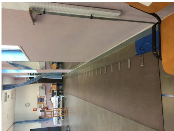
Figura 2 Sistema GAITrite® Walkway.