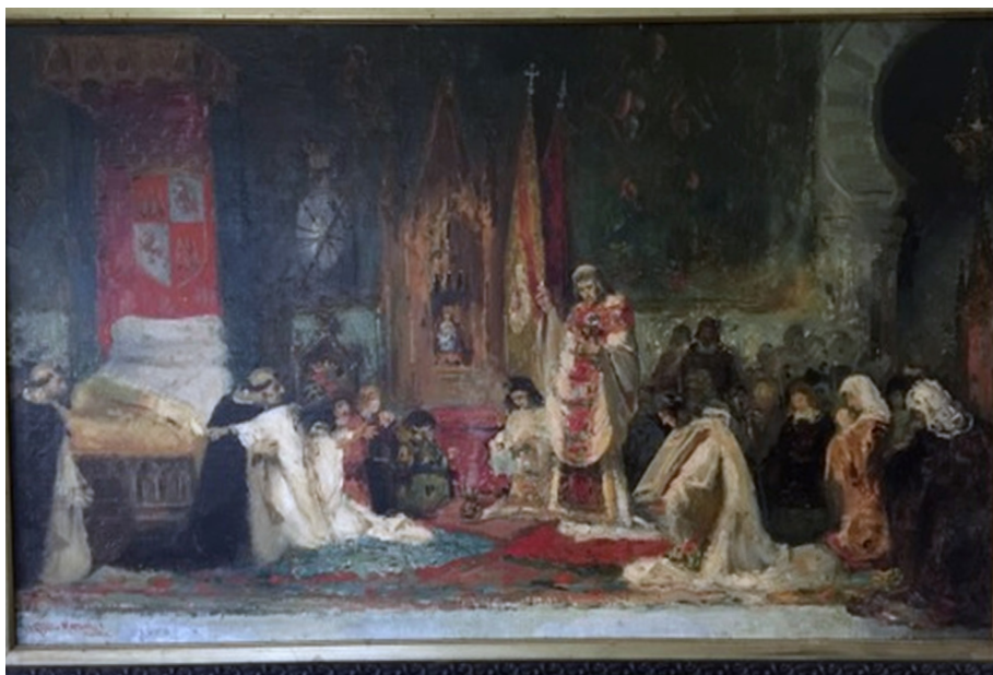
Figura 4. Virgilio Mattoni, Las postrimerías de San Fernando (estudio), 52 x 82 cm, sin fechar, colección particular.