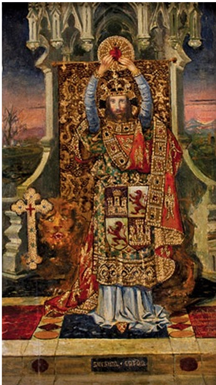
Figura 8. Virgilio Mattoni, San Fernando , 1918, óleo y dorado sobre tabla, 41 x 23 cm, colección particular.