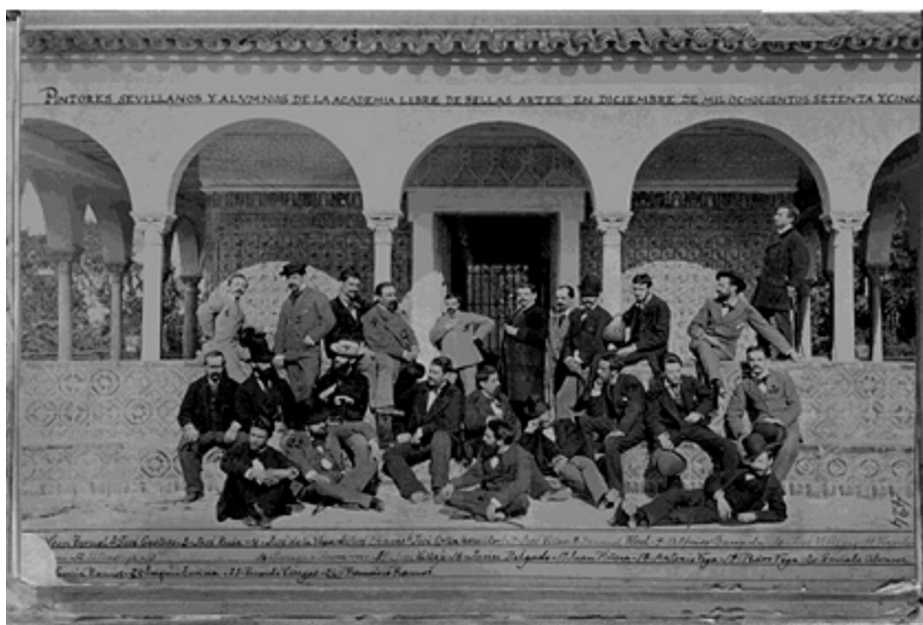
Figura 1. Componentes de la Academia Libre de Bellas Artes de Sevilla, 1875, Fondo Gestoso.