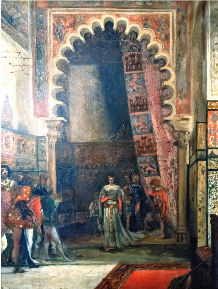
Figura 2. Virgilio Mattoni, La reina Isabel en el Alcázar (boceto), 1900, colección particular.