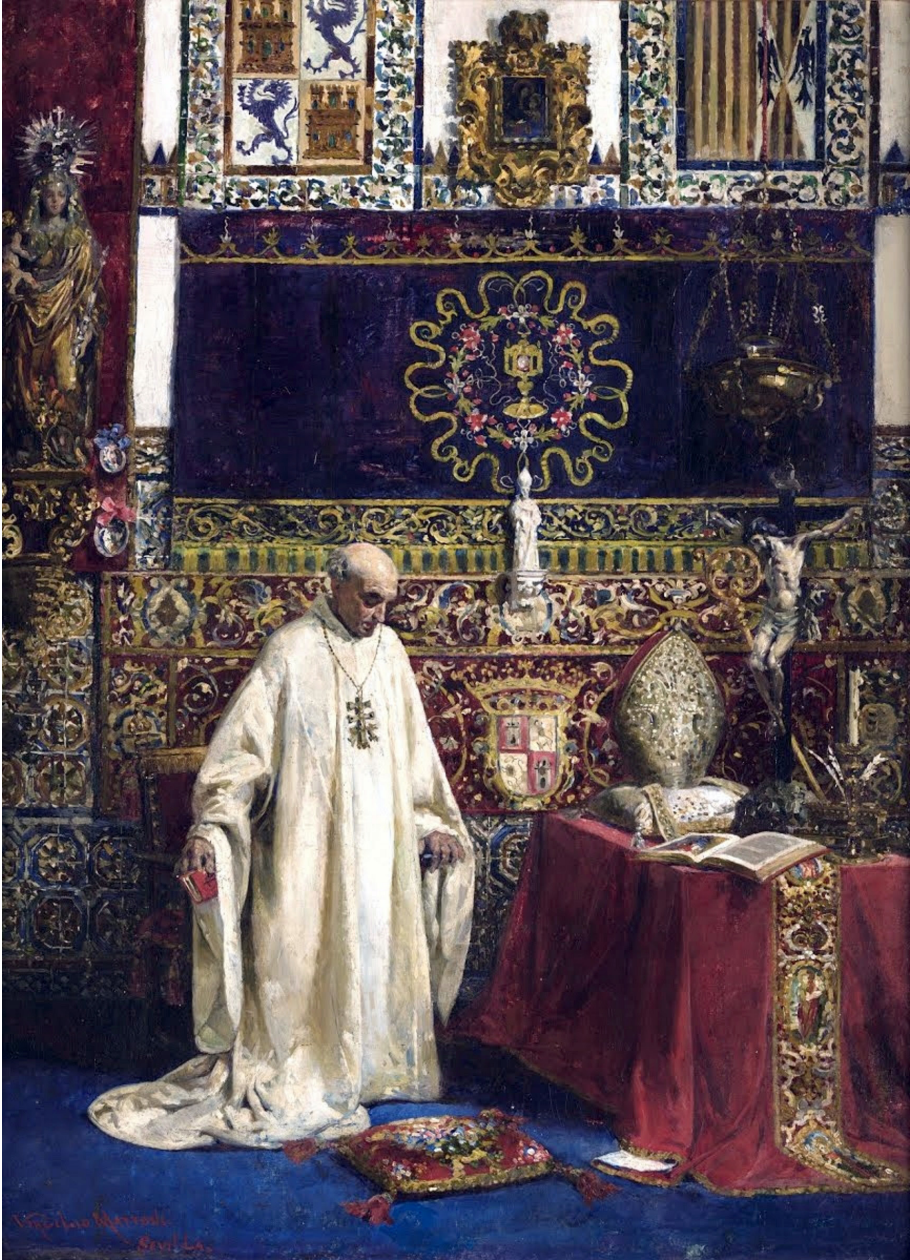
Figura 6. Virgilio Mattoni, El abad , sin fecha, Museo de Bellas Artes de Sevilla.