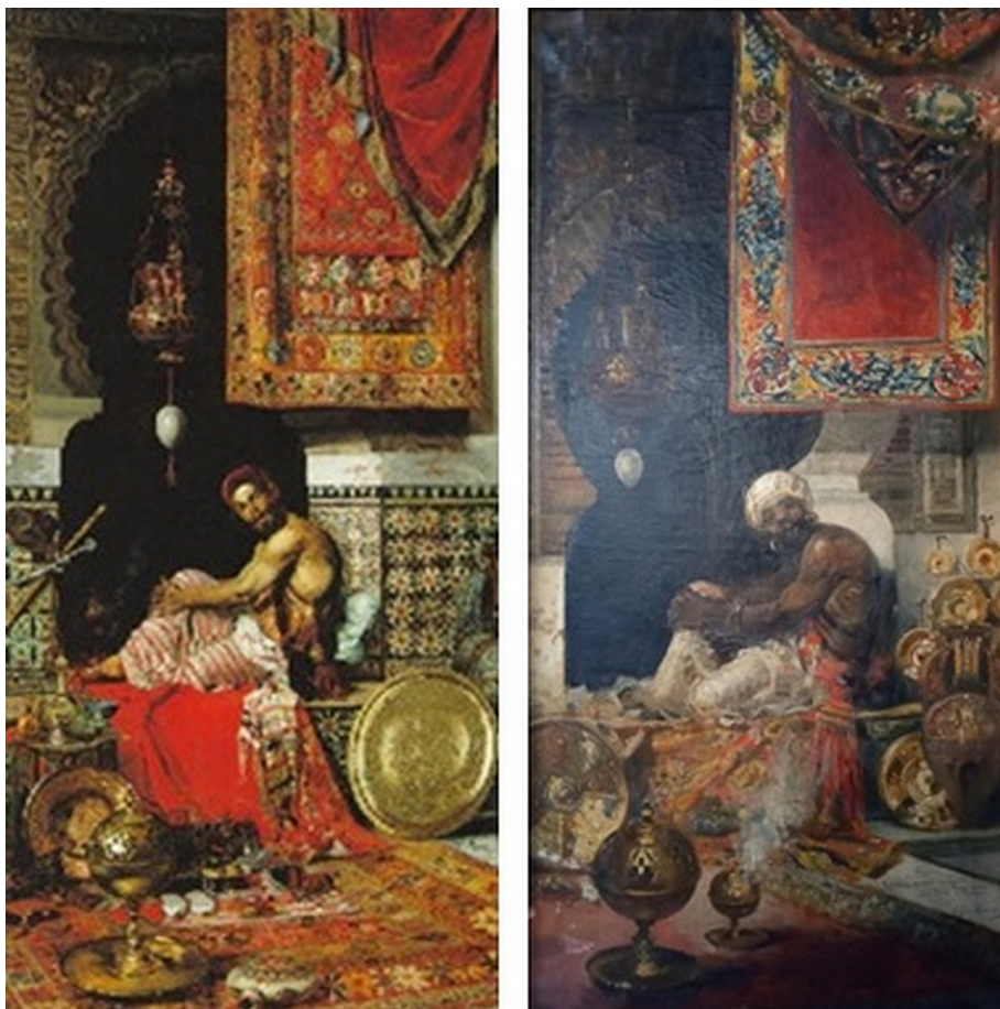
Figura 5. Virgilio Mattoni, Mercader árabe (dos versiones), sin fechar, colección particular.