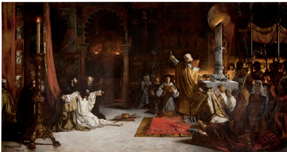
Figura 3. Virgilio Mattoni, Las postrimerías de Fernando III el Santo , 1887, Museo de Bellas Artes de Sevilla (564), depositado en el Real Alcázar de Sevilla.