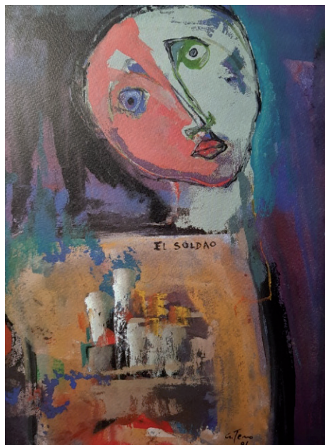
Figura 2. Pintura “El Soldado”. Aurelio Teno.