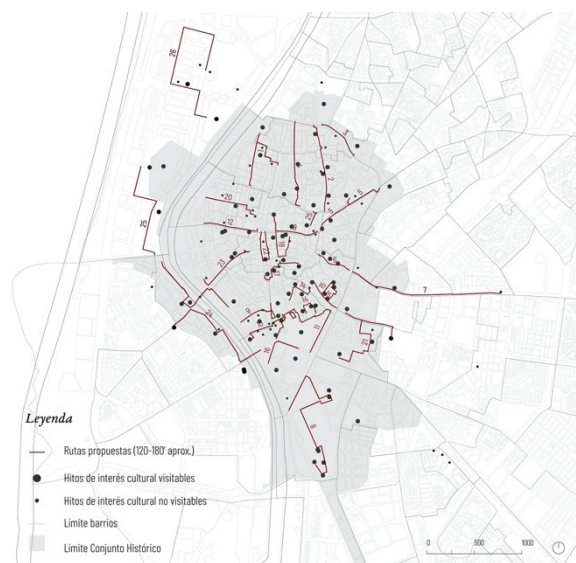
Figura 4. Vicente Gilibert, C., propuesta de rutas urbanas en la ciudad de Sevilla. Plano elaborado con QGIS (elaboración propia).

Teniendo en cuenta las conclusiones extraídas, se ha diseñado una propuesta de agrupación de hitos en rutas cortas caminables (Fig. 4).