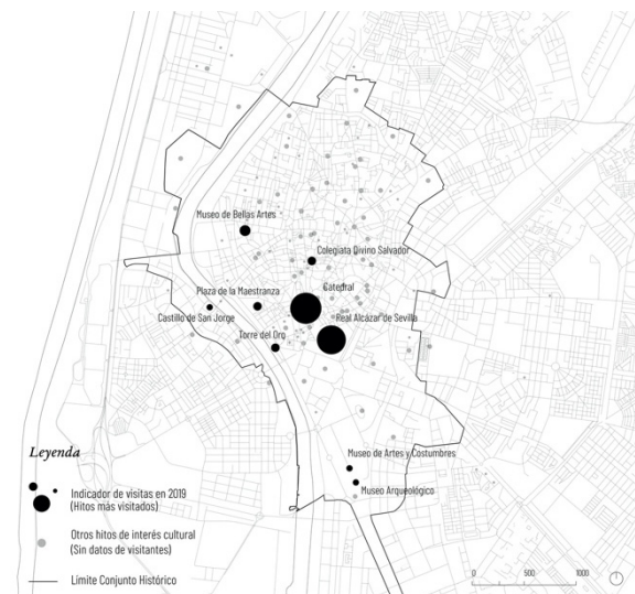
Figura 3. Vicente Gilibert, C., análisis de la proporción de visitas a los hitos culturales de Sevilla más visitados en 2019. Plano elaborado con QGIS (elaboración propia).

La conclusión es que, a pesar de existir una distribución homogénea de hitos en el centro histórico, la actividad turística-cultural más intensa se concentra desproporcionadamente en la zona sur, especialmente en el Alcázar y la Catedral.