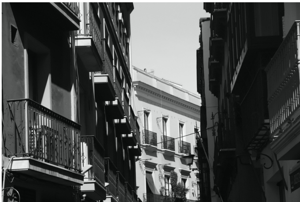
Figura 1. Vicente Gilabert, C., Paisaje urbano del centro histórico de Sevilla. Calle Placentines, 2020 (elaboración propia).

(2) Departamento de Expresión Gráfica Arquitectónica, Universidad de Sevilla