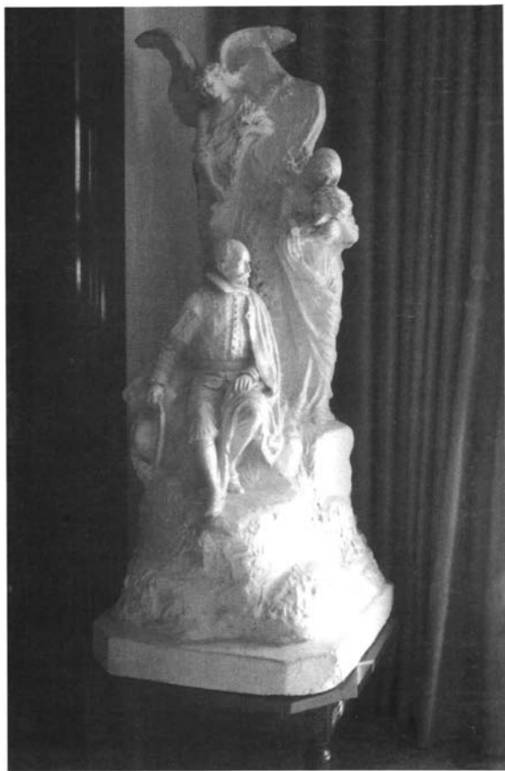
Lám. 4. Boceto del monumento a Martínez Montañés , 1915.