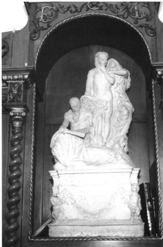
Lám. 1. Boceto de El Genio , 1913.