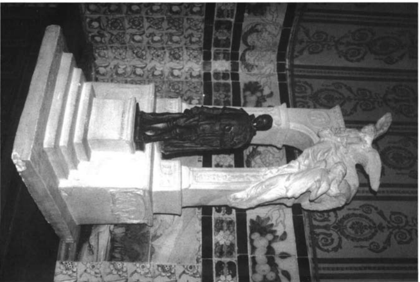
Lám. 2. Boceto del monumento a Martinez Montañés , 1915.