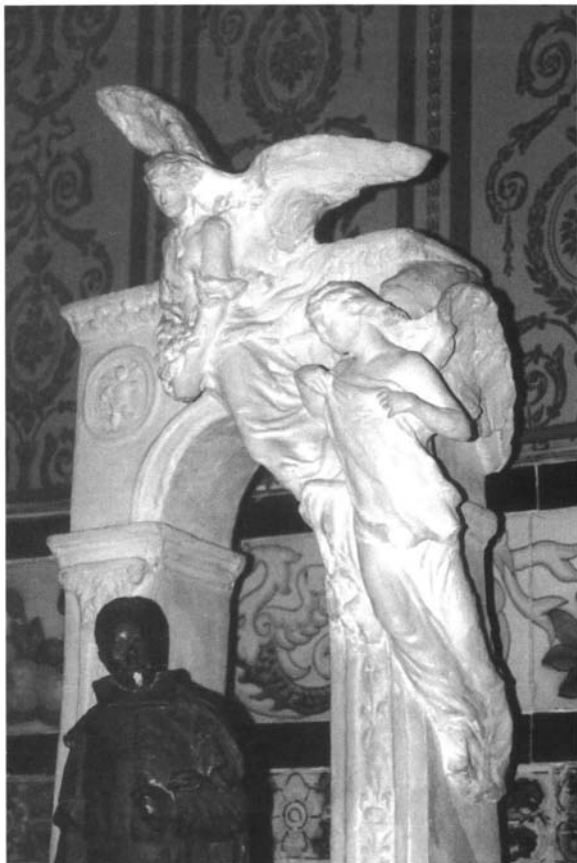
Lám. 3. Boceto del monumento a Martínez Montañés , 1915, detalle.