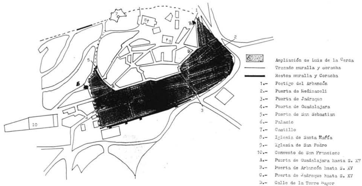
Plano de Cogolludo: Recintos amurallados, puertas y ampliación de D. Luis de la Cerda