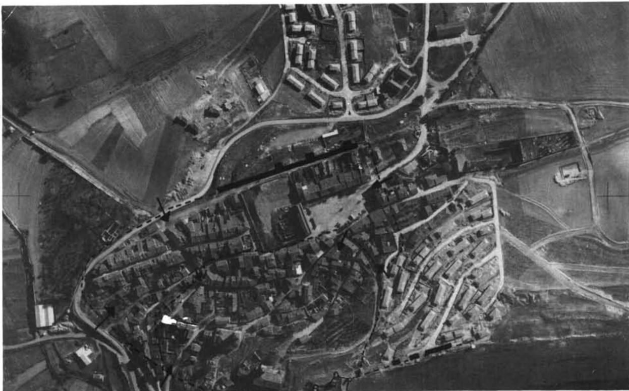
Vista aérea de Cogolludo. Recintos amurallados y puertas