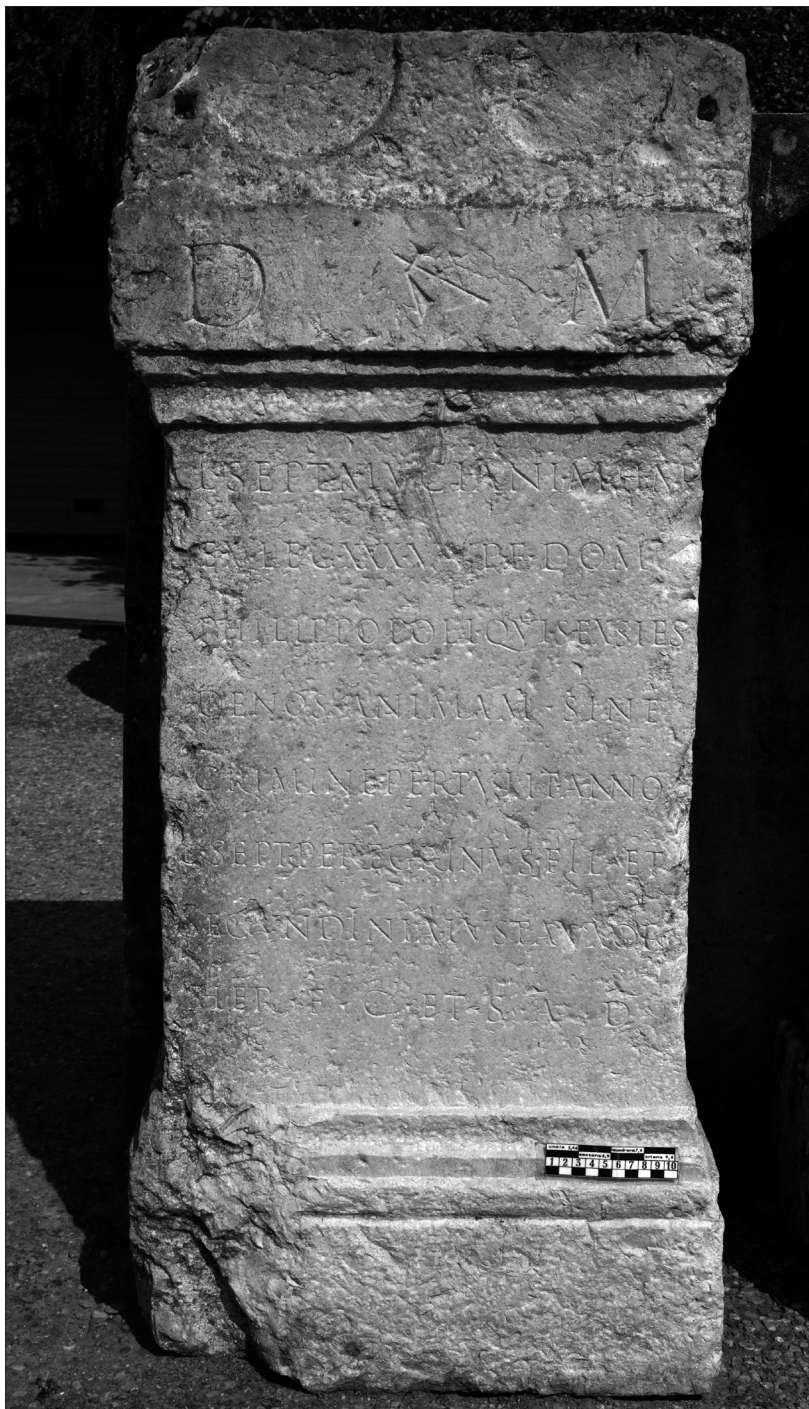
Fig. 2. Foto de conjunto y detalles de A. Bolaños