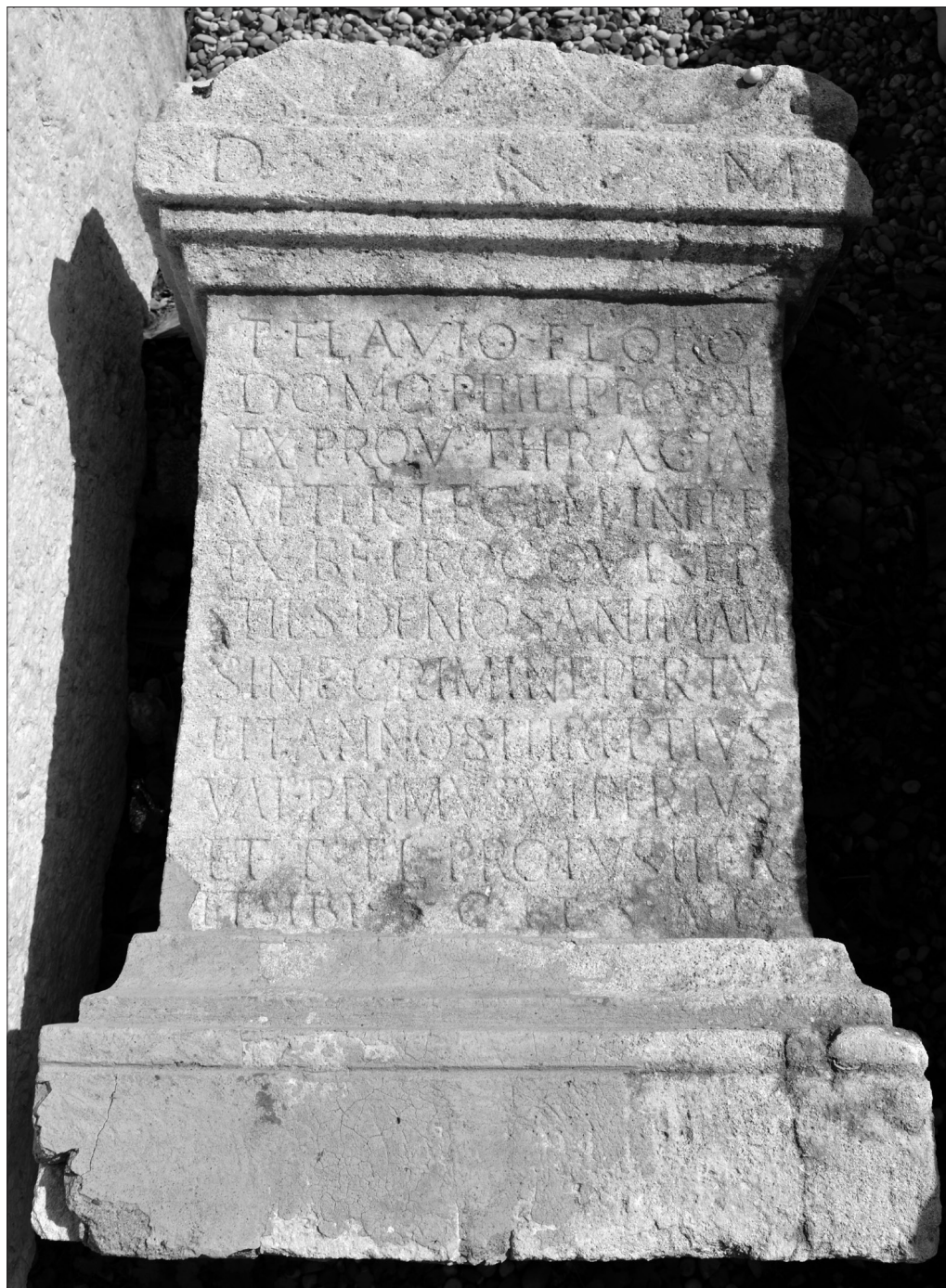
Fig. 1.