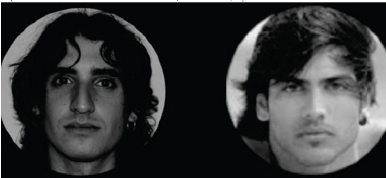
Figura 1. Ejemplo de una cara familiar querida y una cara desconocida atractiva. Las fotografías fueron igualadas en color, tamaño y fondo. Se seleccionaron caras con orientación frontal, mirada al frente y expresión emocional neutra.

Los resultados muestran que las caras queridas activaron una serie de áreas cerebrales encargadas de procesar, por un lado, su valor hedónico y su relevancia motivacional y, por otro, de recuperar los recuerdos asociados con esa persona. La red de activación cerebral identificada en este estudio es coherente con la literatura existente acerca del procesamiento emocional de estímulos positivos y de caras familiares (Bradley y Lang, 2010; Sabatinelli et al., 2007; Gobbini y Haxby, 2007). El dato más interesante de estos resultados es la mayor activación de la corteza orbito-frontal medial ante las caras queridas en comparación con caras altamente atractivas. Éste área cerebral está relacionado con la monitorización, aprendizaje y memoria del valor reforzador de la recompensa (Kringelbach, 2005). Este resultado es coherente con nuestra hipótesis de que las caras de personas queridas tienen un valor reforzador superior a las caras físicamente atractivas. La activación encontrada en la corteza motora suplementaria