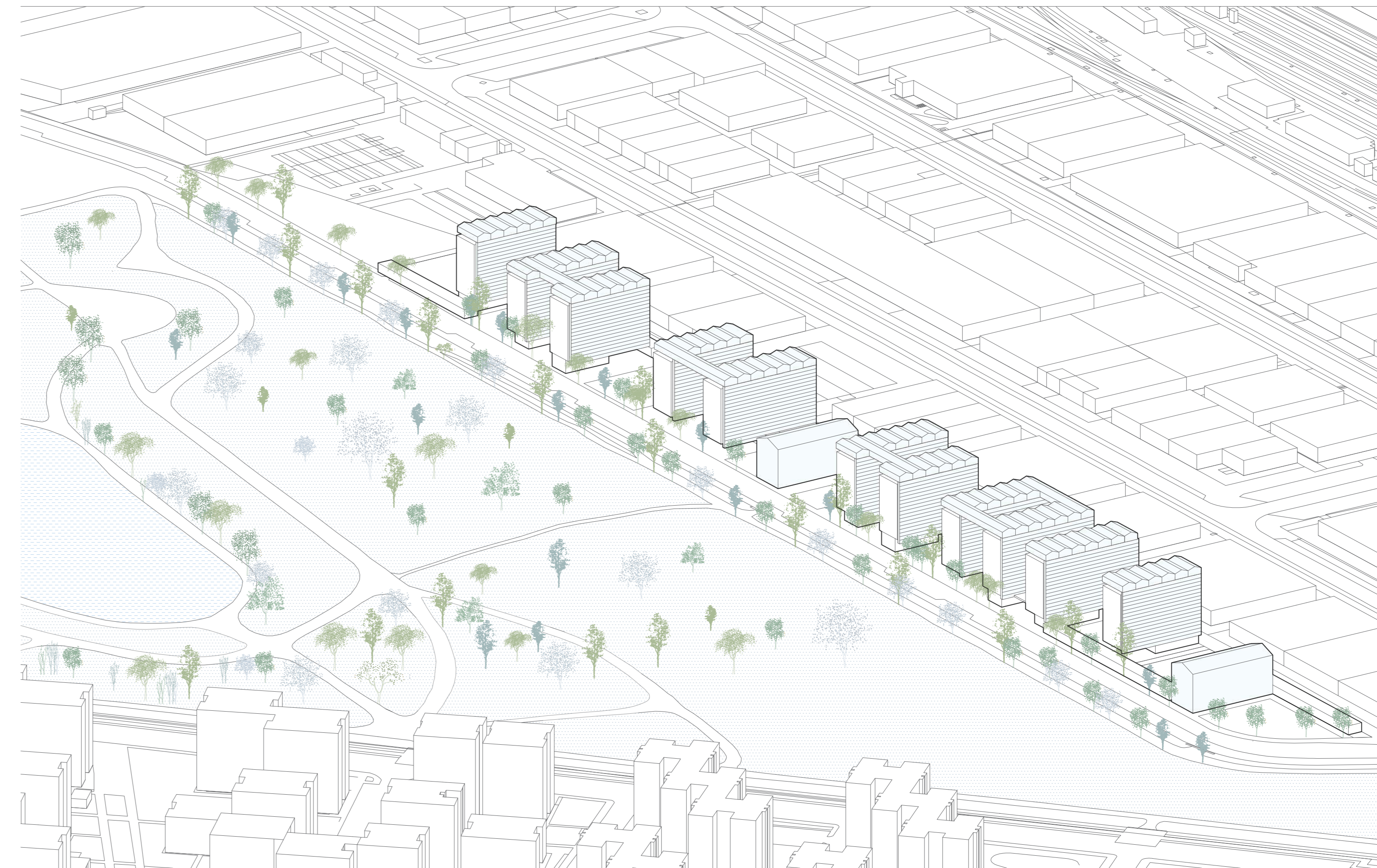
Volumetría de ordenación del sector