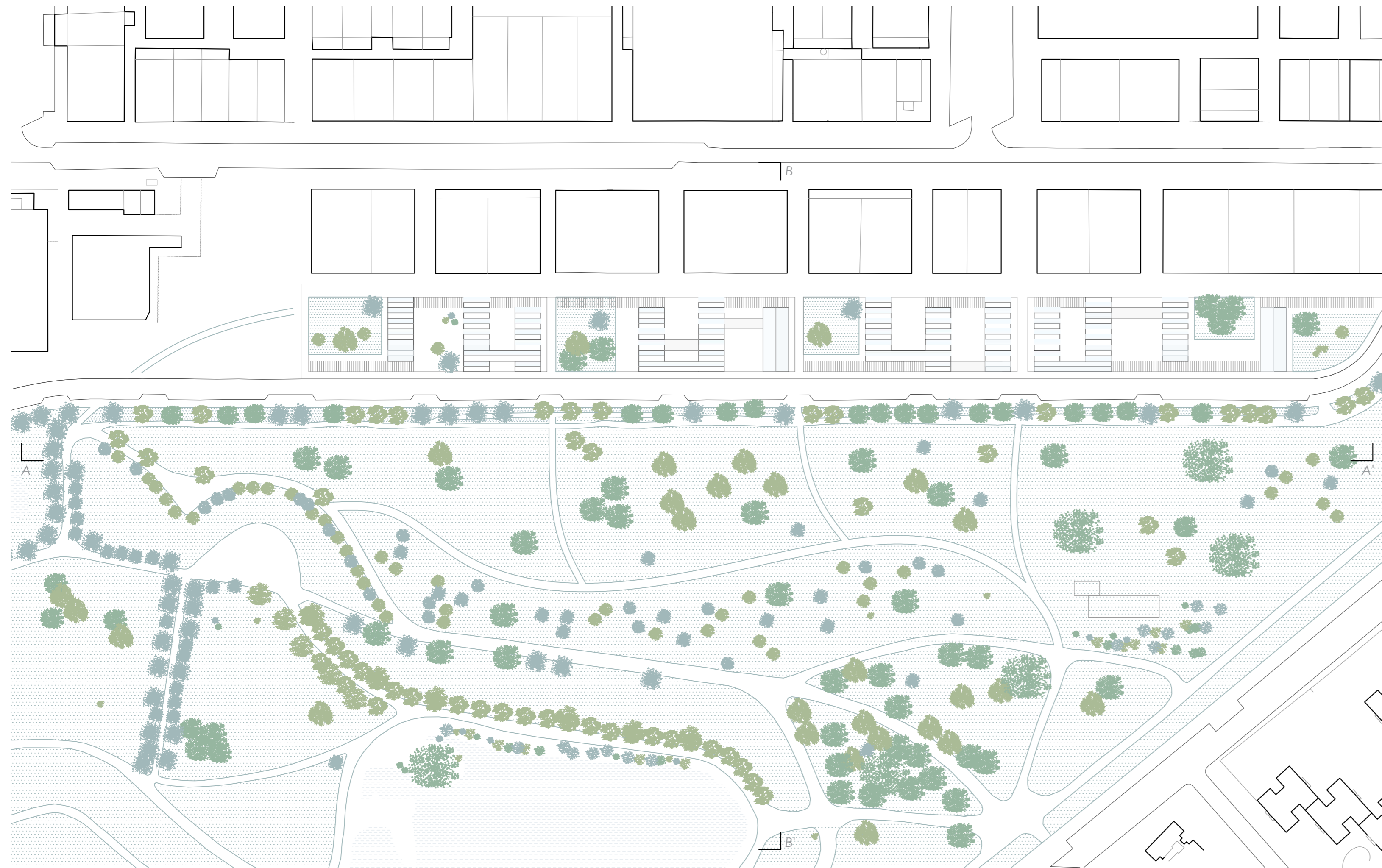
Plano de ordenación del sector