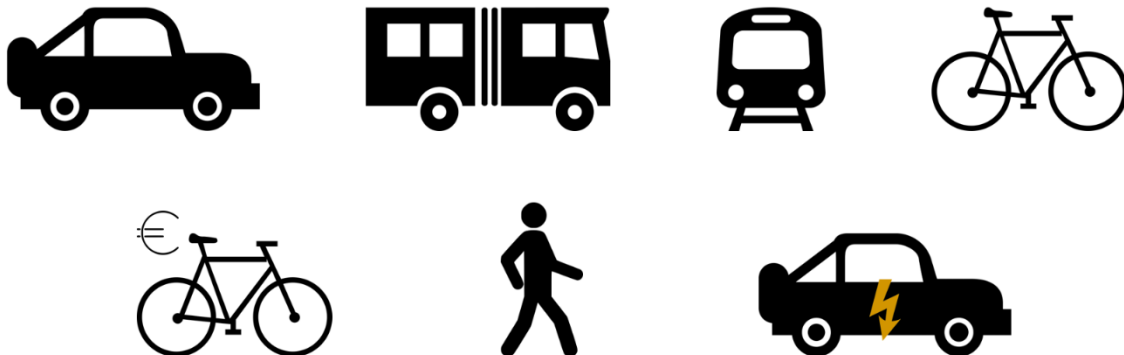
Figura 1: Medios de transporte analizados en la encuesta

El criterio para la elección de los medios de transporte es el siguiente. Los seis primeros, son los más utilizados por los estudiantes según trabajos anteriormente realizados (Cruz-Rodríguez et al., 2020). A estos se ha unido el coche eléctrico. A pesar de no estar entre los medios de transporte más utilizados, supone una alternativa al uso del coche de combustión (Simsekoglu, 2018). En trabajos anteriores, los usuarios de los medios de transporte (Cruz-Rodríguez et al., 2020) señalaron este medio de transporte como el preferido para sustituir su medio de transporte más habitual actual.