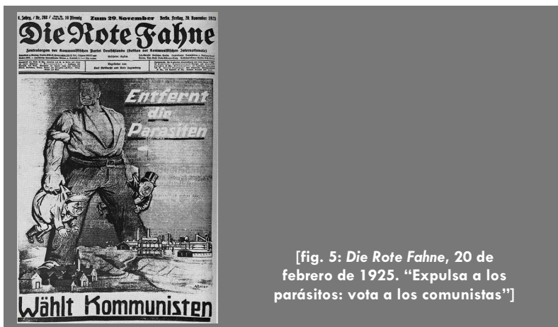
[fig. 5: Die Rote Fahne, 20 de febrero de 1925. “Expulsa a los parásitos: vota a los comunistas”]

¿Sabéis lo que ahora me preocupa? No estoy nada satisfecha con la forma en la que se escriben en el Partido la mayoría de los artículos. Todo es tan convencional, tan acartonado, tan rutinario. [...] Creo que cada vez, cada día, en cada artículo hay que sentir y revisar la causa, entonces surgirán con facilidad palabras frescas, palabras salidas del corazón para la vieja causa (en Fröhlich, 1976, p. 75).