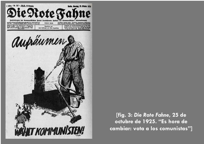
[fig. 3: Die Rote Fahne, 25 de octubre de 1925. "Es hora de cambiar: vota a los comunistas"]

normalidad en Berlín como consecuencia del esfuerzo de las fuerzas policiales del Reich y de las propias organizaciones sindicales existentes, poco influidas por el estilo de lucha bolchevique y decididas a enfrentar el papel de los delegados revolucionarios que se habían nombrado en la mayoría de fábricas.