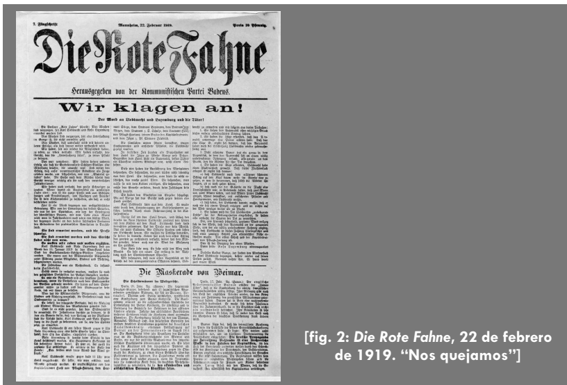
[fig. 2: Die Rote Fahne, 22 de febrero de 1919. “Nos quejamos”]

utilizar la crisis económica y política creada como instrumento de agitación a nivel de las capas populares para acelerar la caída y liquidación del dominio capitalista (Badía, 1971, p. 20). La alianza antimilitarista y la convicción de que la guerra podría ser empleada en el derrocamiento de las estructuras de poder, unían a este grupúsculo alineado a la izquierda del SPD que exhibía su disconformidad con las decisiones adoptadas por el aparato disciplinario del partido en 1914. Para Liebknecht y Luxemburgo, y junto a ellos otras personalidades sensibles a las tesis internacionalistas, como eran Franz Mehring y Clara Zetkin, la esencia de la guerra que mermaba a la población seguía siendo fundamentalmente burguesa.