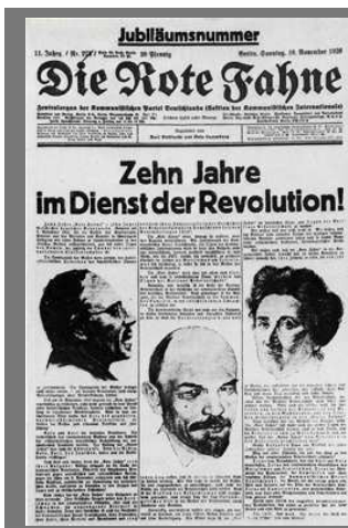
[fig. 7: Die Rote Fahne , 18 de noviembre de 1928. “Diez años al servicio de la revolución” (Número especial)]

hombre de confianza de Ebert, fue entendido como una provocación a los espartaquistas, quienes hicieron desde Die Rote Fahne continuos llamamientos a la población para que saliera a las calles y pusiera en peligro la tranquilidad de las instituciones republicanas.