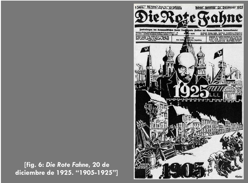
[fig. 6: Die Rote Fahne , 20 de diciembre de 1925. "1905-1925"]