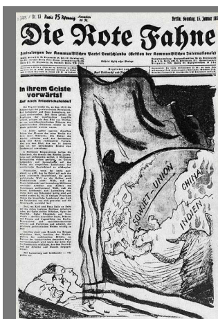
[fig. 8: Die Rote Fahne , 15 de enero de 1933. “Continuemos su obra hacia la libertad”]