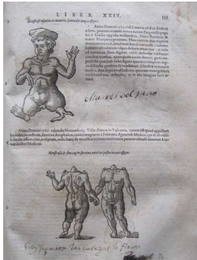
Ilustración 2 Efigie de un infante monstruoso con partes femeninas” está bautizada como “Álvarez del Pino.

De los libros dieciochescos, 2 pertenecen a esta temática el de Pless y el de Rodríguez y Felix. Esto va en línea con la puesta en práctica de las Reformas Borbónicas y sus conocimientos ilustrados. El segundo tema, cuya práctica era, cuando menos, mal vista dentro de los círculos eruditos en los siglos anteriores, es la cirugía. Así, encontramos que en la mayoría de los libros del XVIII se encuentra un apartado de cirugía y encontramos 2 títulos dedicados específicamente a ese tema: el de Boerhaave y el de Tencke.