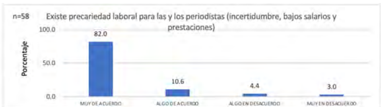
Grafica 03. Precariedad laboral

La encuesta aplicada muestra en más del 90% de las respuestas que se percibe precariedad laboral y es un porcentaje similar el que asegura que trabajar en un solo medio de comunicación ya no es suficiente en sentidos de ingresos dignos, razón por la cuál, más del 60% de los encuestados menciona que necesita realizar al menos una actividad más para nivelar dicha carencia. Por si esto fuera poco, cerca del 40% de los periodistas afirmó no contar con el equipo técnico para llevar a cabo su trabajo. Las siguientes gráficas 03, 04 y 05 muestran la información mencionada previamente y proveen una imagen crítica de la situación actual de los periodistas.