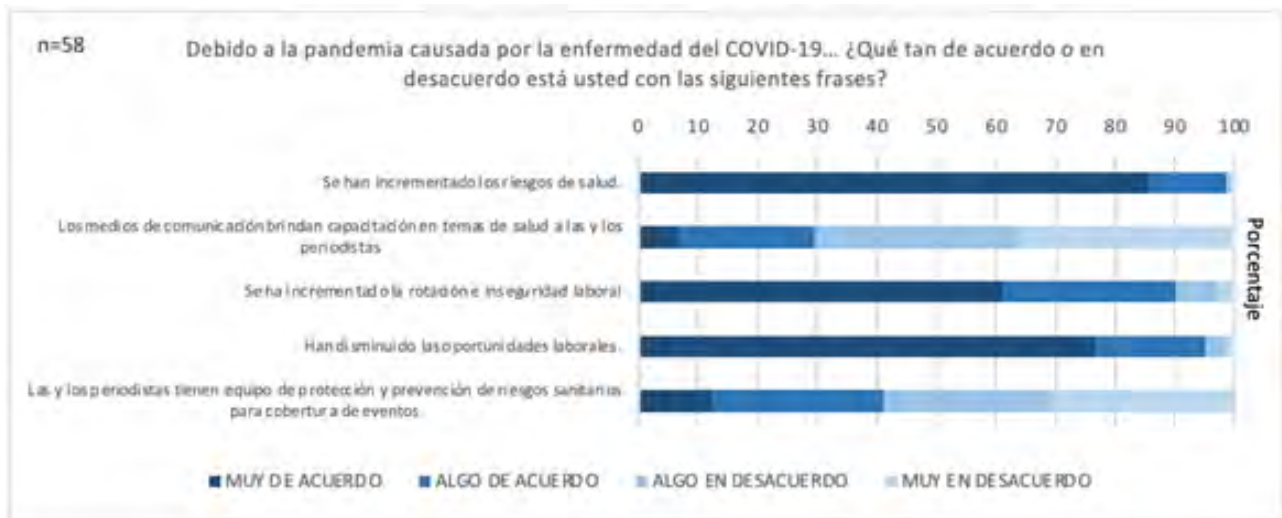
Grafica 08. Pandemia

La gráfica 08, muestra cómo la crisis sanitaria por el COVID-19 es percibida también como uno de los principales obstáculos para el periodismo, pues además de que más del 50% percibe que no cuentan con el equipo de protección y prevención de riesgos sanitarios para la cobertura de eventos, los periodistas notan que incluso en este aspecto la falta de capacitación es importante, sobretodo considerando que los riesgos a su salud se han incrementado significativamente. No se puede dejar de considerar que, al mismo tiempo, la propia crisis ha causado una disminución importante en las oportunidades laborales para las y los periodistas.