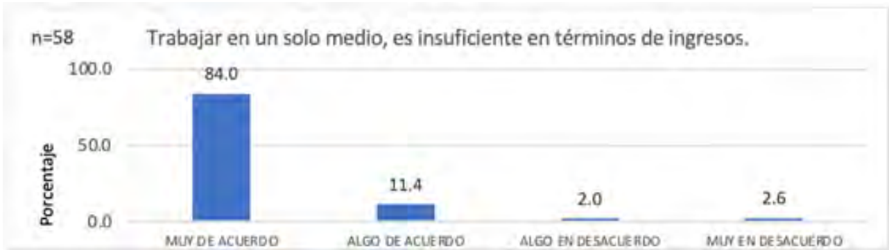
Grafica 04. Ingresos