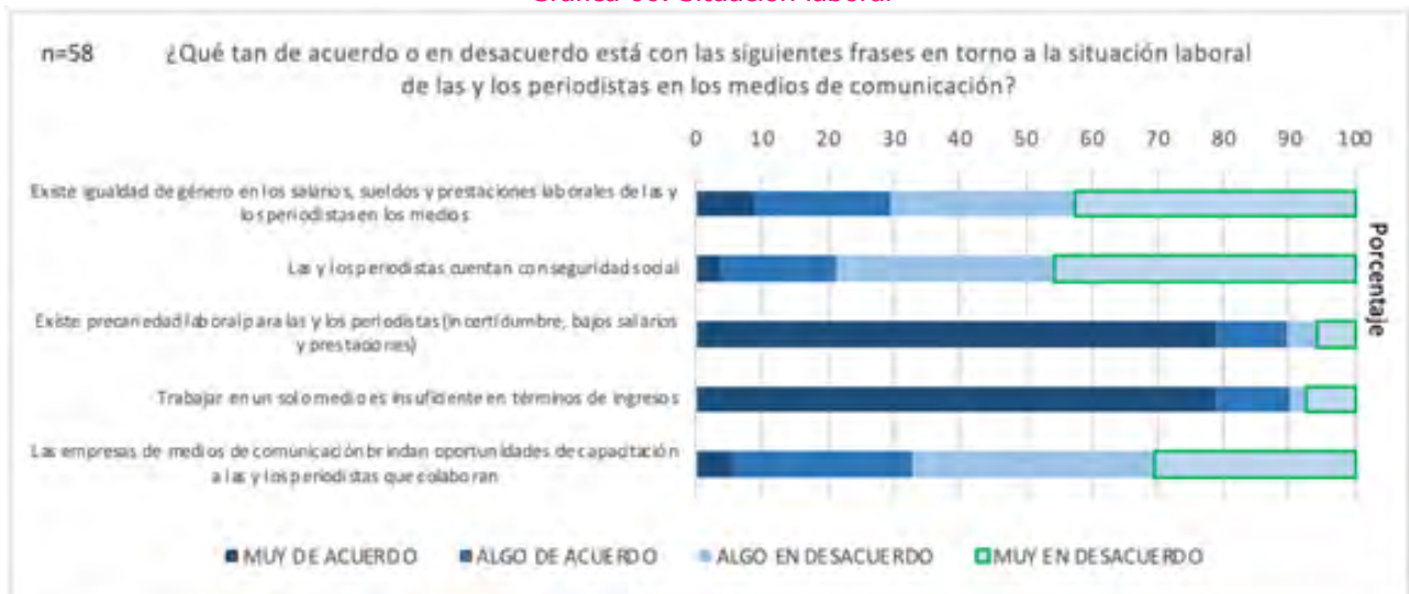
Grafica 06. Situación laboral

La gráfica 06 representa las condiciones de incertidumbre, bajos salarios y falta de prestaciones, son características de dicha precariedad que enfrentan los periodistas, además en más del 70% se percibe falta de seguridad social, porcentaje muy cercano a la cantidad de respuestas que deja en evidencia que no se percibe una igualdad de género en los salarios, sueldos o prestaciones laborales..