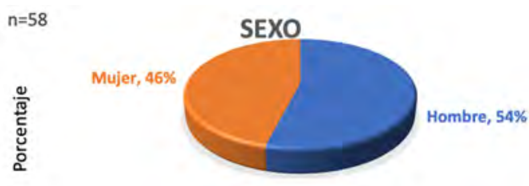
Grafica 01. Género / encuestado

La muestra se conforma de 58 periodistas seleccionados de forma intencional para asegurar que se incluyen representen de los estados del noreste de México (Nuevo León, Coahuila y Tamaulipas) y el instrumento ha sido aplicado desde Microsoft Forms. El sujeto de estudio es definido como periodista, el cuál es aquella persona que se dedica en forma profesional al periodismo a través de cualquier medio, ya sea prensa, radio, televisión y/o medios digitales, incluso algunos de los observados participan en más de uno. La distribución de género y los medios en los que se desarrollan los encuestados, se pueden observar en las siguientes gráficas.