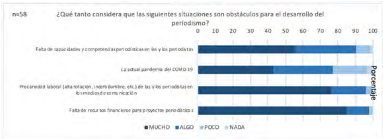
Grafica 07. Obstáculos periodismo