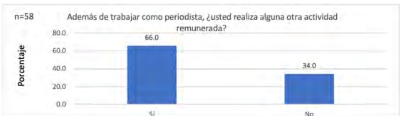
Grafica 05. Actividad remunerada