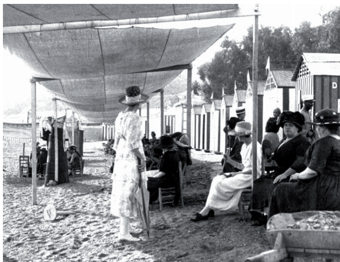
Fig. 2. Baños del Carmen.