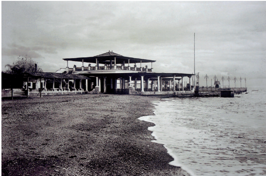
Baños del Carmen. Málaga. 1920-30. ACM-9-22315 IEFC-CTI.