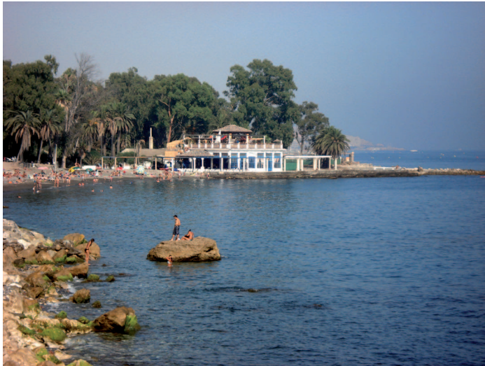
Fig. 2. Baños del Carmen.

Mientras tanto, sigue latente en muchos de nosotros la necesidad de recuperar este espacio singular para la ciudad. Un rincón de Málaga, de su historia, de sus costumbres y tradiciones. Necesidad de construir una propuesta patrimonial que cuente entre sus objetivos con el reconocimiento y proyección cultural e histórica no sólo de un elemento arquitectónico, sino de algo más complejo. Hablamos de historia, de cultura, de actividades industriales, de tradiciones marineras, de artesanías milenarias, de arquitectura y de paisaje. Unos Baños del Carmen que miran con desdén por encima del agua, en un intento de seguir escribiendo su historia, la historia de Málaga.