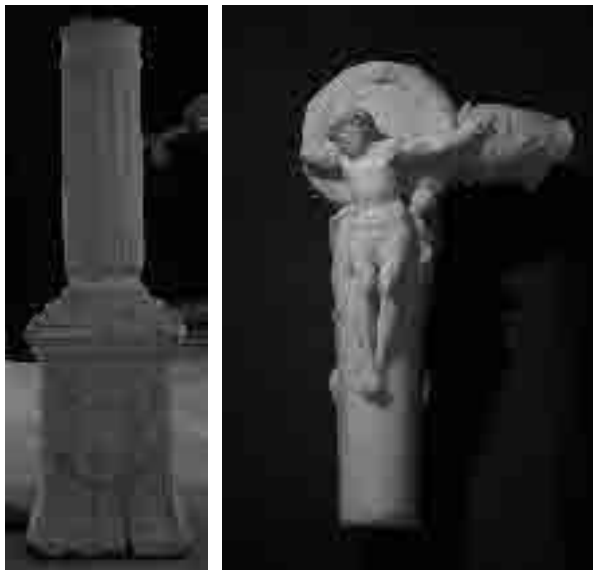
Roque de Balduque, 1545, Humilladero de San Isidoro del Campo (Santiponce), Museo Arqueológico Provincial de Sevilla. Detalles.