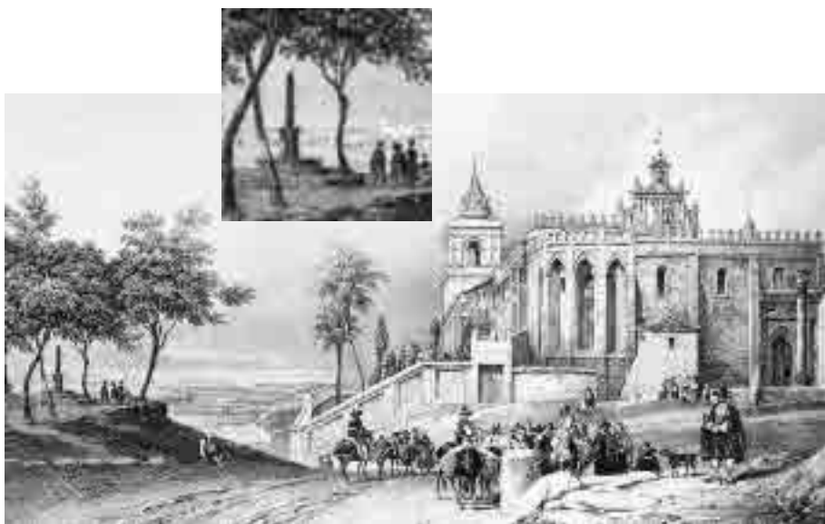
Nicolas Chapuy (dib.), Benoist, (lit), San Isidoro del Campo (1844). Detalle y pormenor.