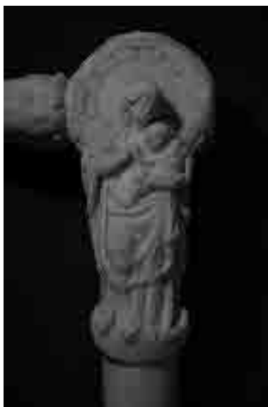
Roque de Balduque, 1545, Humilladero de San Isidoro del Campo (Santiponce), Museo Arqueológico Provincial de Sevilla. Pormenor.