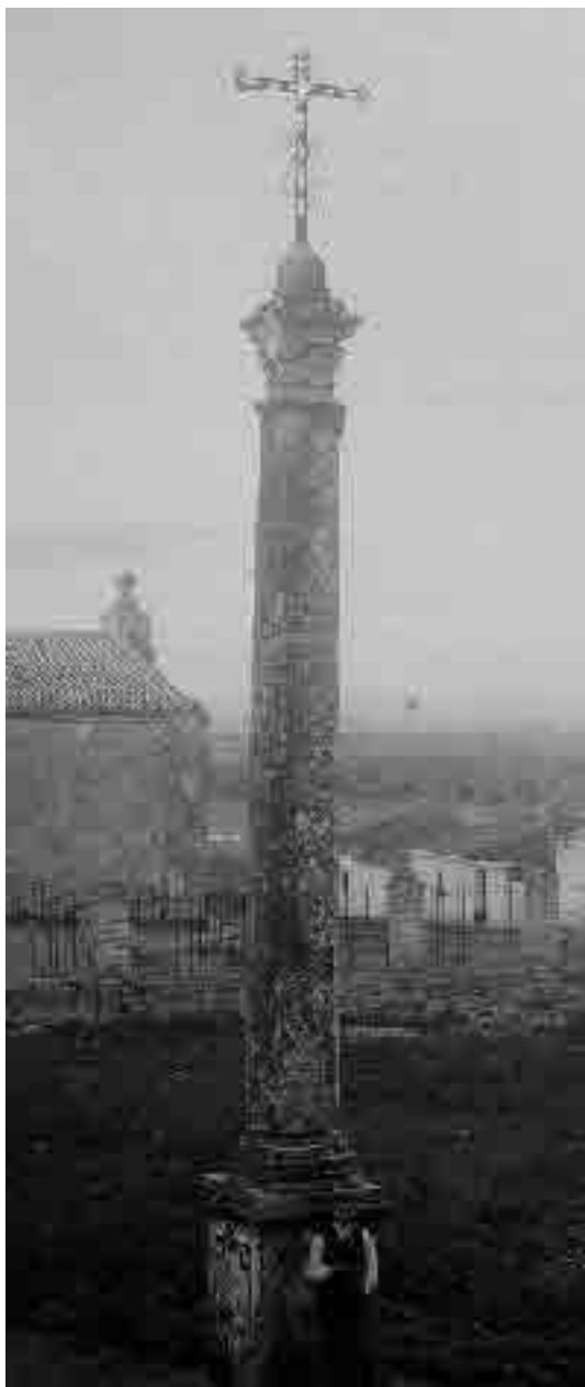
González-Nadín, J. M a , fotografía de la Cruz del atrio, diciembre de 1924, Fototeca del Laboratorio de Arte, detalle.