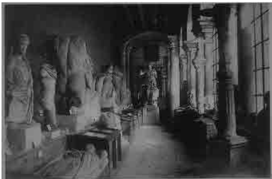
Anónimo. Museo de Bellas Artes . Fotografía de principio del siglo XX, fechada a partir de mostrar al fondo a Diana que apareció en 1900. Galería sur del claustro principal, en sentido Oeste. En el extremo derecho en primer plano el crucero de San Isidoro del Campo, detrás crucero de Villanueva del Ariscal