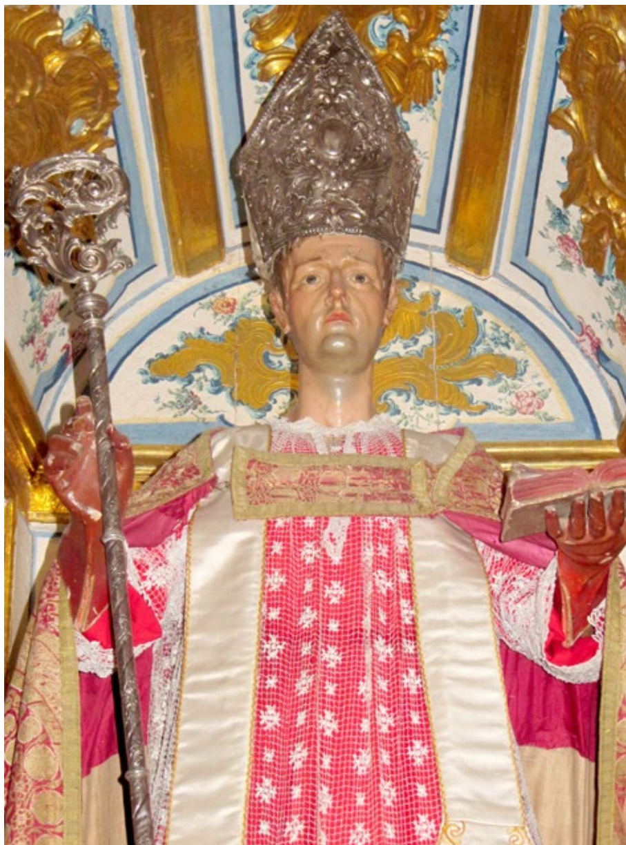
Figura 9 . San Blas, capilla sacramental de la iglesia de San José, vulgo de San Diego.