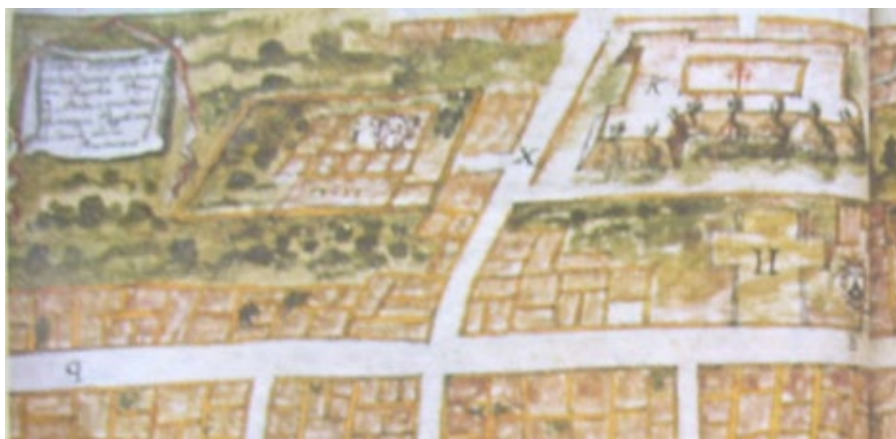
Figura 4. Detalle del plano de Sanlúcar realizado por Antonio Matheo Borrego en 1699.