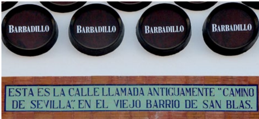
Figura 2. Azulejo que marca el camino de Sevilla en el antiguo barrio de San Blas. Actual calle Sevilla.