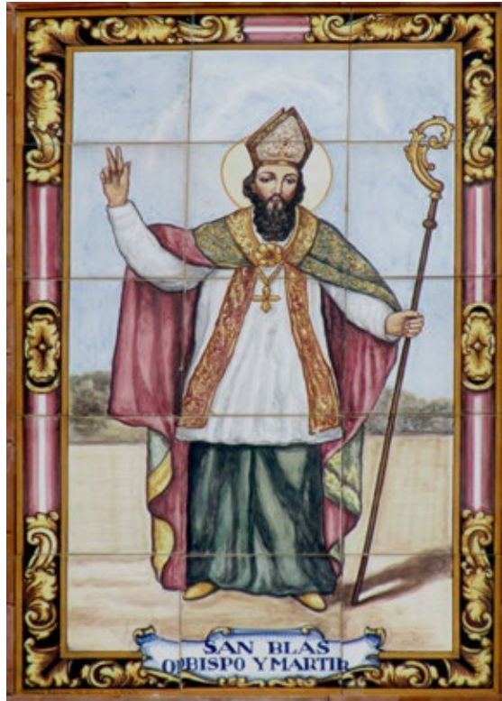
Figura 1. Azulejo de San Blas en la calle Sevilla. (M. Romero, Mensaque Rodríguez, Sevilla).