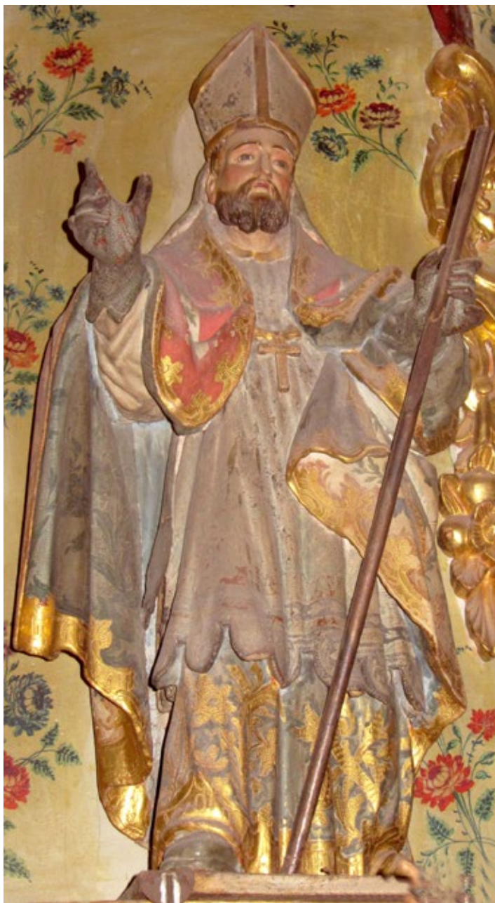
Figura 10 . San Blas, retablo de San José, iglesia de Ntra. Sra. del Carmen.