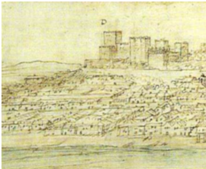
Figura 3. Detalle de la vista de Sanlúcar de Antón Van den Wyngaerde realizada en 1567, Ashmolean Museum de Oxford.