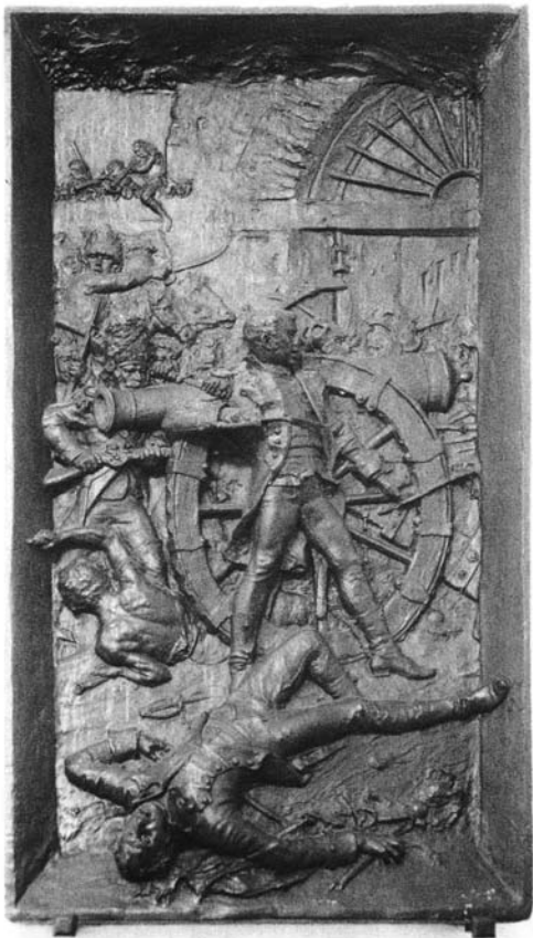
Lám. 3.- La Defensa del Parque de Artillería.