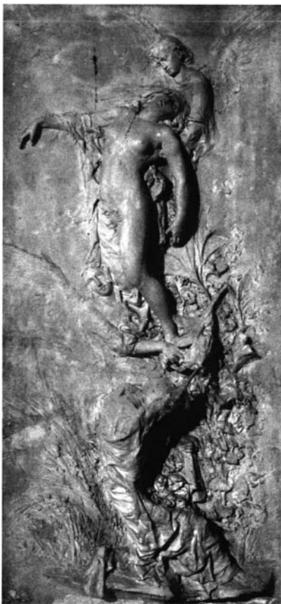
Lám. 2.- Alegoría de la Muerte.