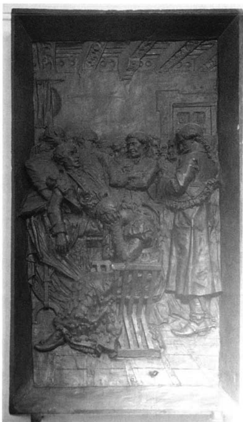
Lám. 4.- La muerte de Daoiz.