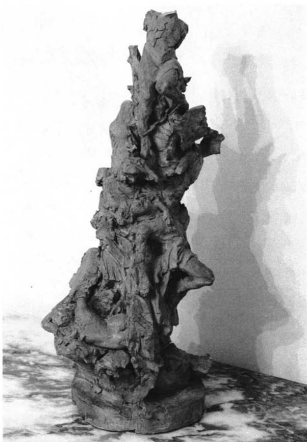
Lám. 7- Anatomía del Corazón.