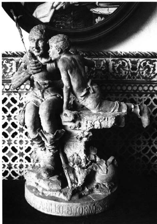
Lám. 5.- El Lazarillo de Tormes.