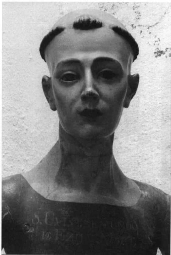
Figura 3. San Wistremundo de Écija