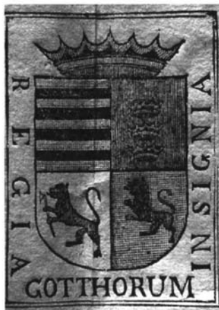
Figura 2. Detalle del escudo de los godos en el almanaque de 1773 y Aparición de Santa Florentina a la comunidad. Convento de San Pablo y Santo Domingo