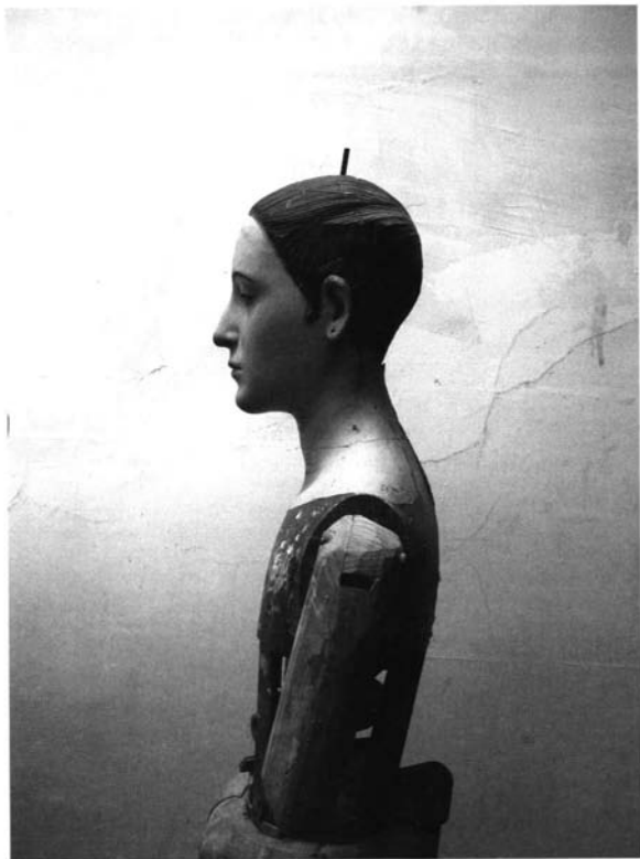
Figura 4. Virgen de la Saleta