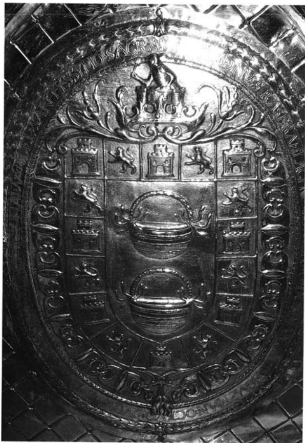
Lámina 3. Escudo del frontal primitivo del Santuario de Ntra. Sra. de la Caridad.