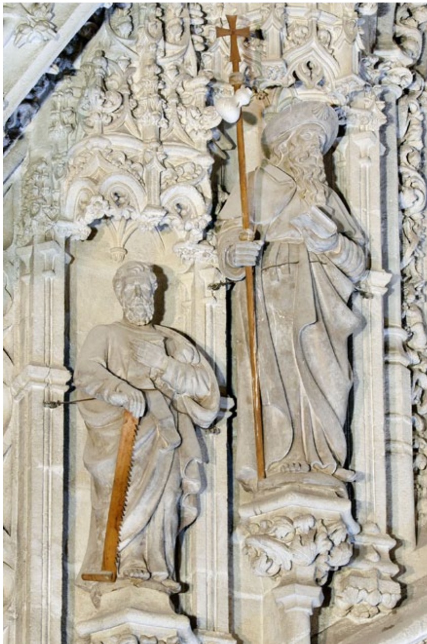
Figura 10. Catedral de Sevilla, cruceo muro W-S. Anónimo, hacia 1896-1900: San Simón apóstol y San Santiago el Mayor apóstol.