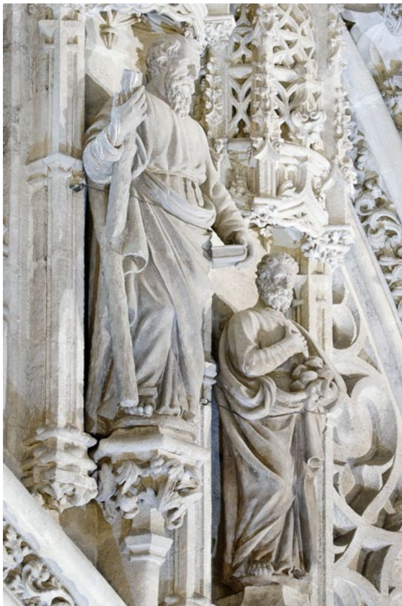
Figura 9. Catedral de Sevilla, crucero muro S-E. Anónimo, hacia 1896-1900. San Andrés apóstol y San Bernabé apóstol.