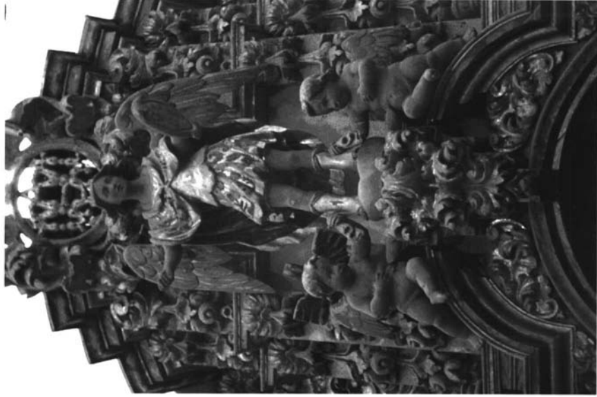
Capilla. Remate del retablo. San Miguel Arcángel. Hacienda de Palma Gallarda