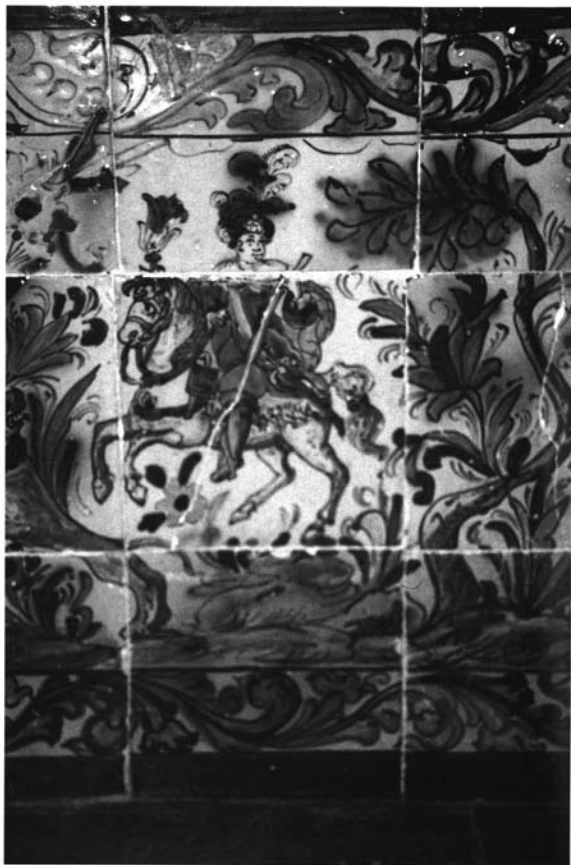
Capilla. Zócalo de azulejos. Hacienda de Palma Gallarda