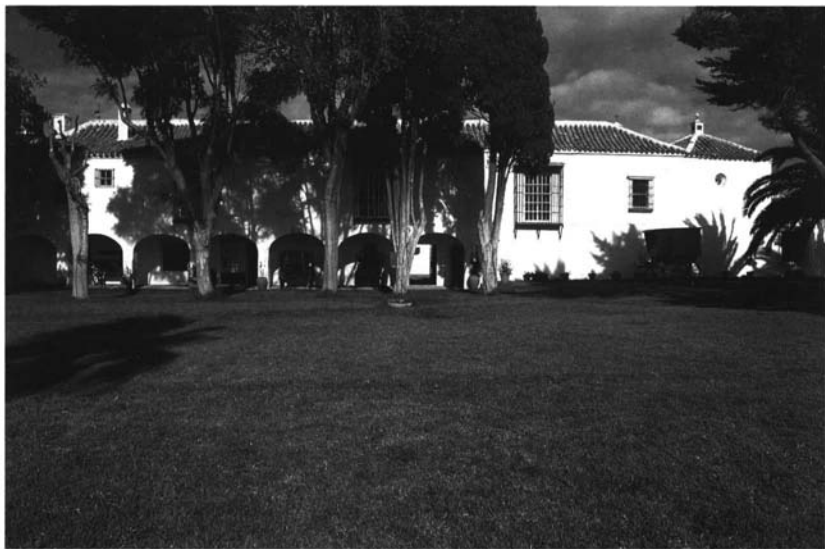
Fachada del Jardín. Hacienda de Palma Gallarda