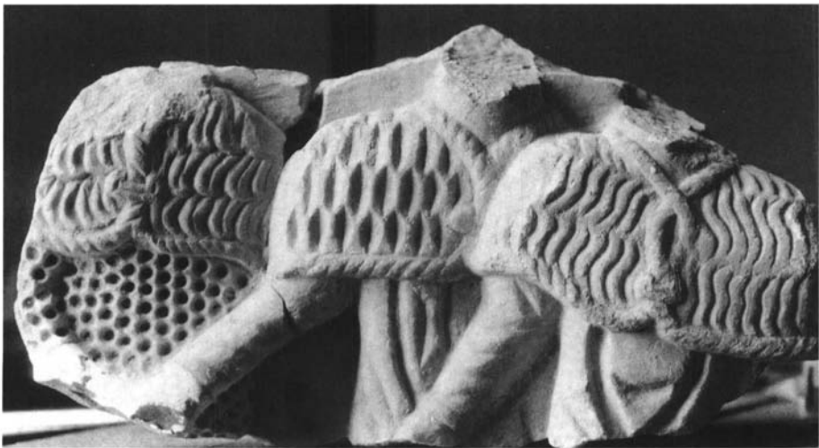
Fig. 1. Fragmento de relieve de sarcófago, aparecido en Madinat al-Zahra (Córdoba). Fondos del Conjunto Arqueológico de Madinat al Zahra (Córdoba).