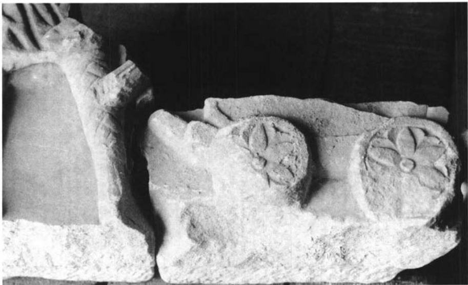
FIG. 3. Idem ; fragmento en que se reproduce parte de un carro, que une con el reproducido en la figura anterior (derecha).