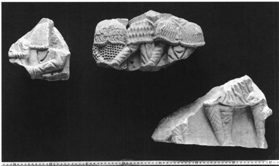
FIG. 2. Idem ; junto a la pieza reproducida en la figura anterior (centro) se recoge otros dos fragmentos del mismo frente de sarcófago. Fotografía: Instituto Arqueológico Alemán de Madrid (P. Witte).