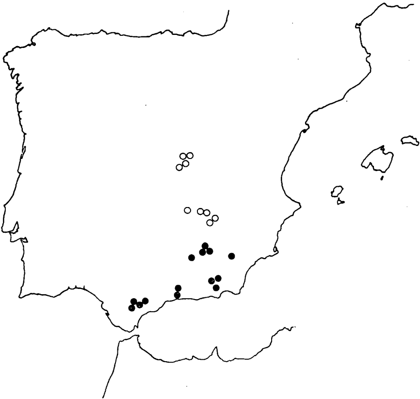
Mapa 1.—Localidades estudiadas de: ● S. boissieri y ○ S. almolae .

dicaciones que coinciden exactamente con las figuras del ícón 26 de BOISSIER. Esta descripción no sería publicada, ya que al recibir el material cultivado en 1850 de S. boissieri , ve que no existen diferencias entre ésta y S. germana , que él había publicado en un trabajo de COSSON (1849) y así lo indica en otra de las notas manuscritas por él en 1851 y que se encuentra en dicho pliego. Por todo lo anteriormente expuesto, se deduce que el único elemento que disponía GAY al hacer válida la publicación de S. boissieri , es el ícón de BOISSIER por lo que dicho ícón debe constituir el tipo de Silene boissieri .