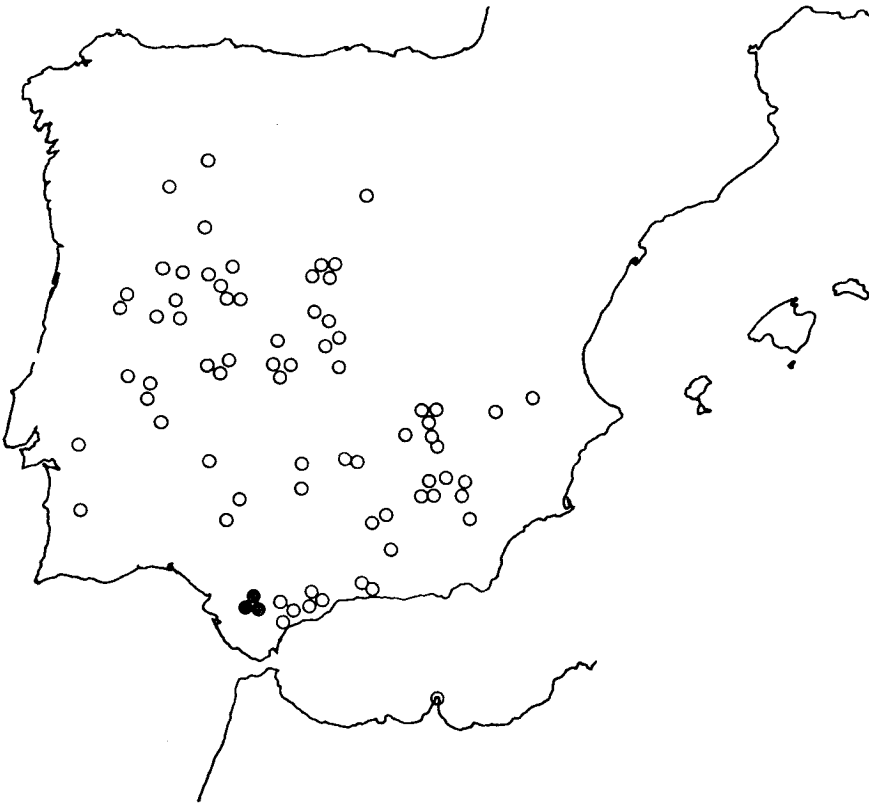
Mapa 3.—Localidades estudiadas de: ● S. stockeni y ○ S. psammitis .

(MA 30887). Sierra de Alcaraz, sin fecha, Huguet del Villar (MAF 59486); ídem, entre Vianos y Tortas, 3.VI.1978, Devesa, Pastor & Valdés (SEV 32578). Monte Lhugron, 3.VI.1891, Porta & Rigo (MA 30907). Almería . Sierra María, VI.1899, Reverchon (MA 31618); ídem, 8.V.1954, Rufino (SEV 29487); ídem, V.1962, Losa & Rivas Goday (MAF 88808). Avila . Avila, VI.1900, Barras (MA 30880); ídem, V.1907, Pau (MA 30881); ídem 23.IV.1933, Ceballos (MA 30882). Badajoz . Sierra del Duque, cerro del Cabezo, 7.VI.1969, Ladero (MAF 83987). Sierra de Tentudía, 2.VI.1952, Rivas Goday & Rivas Martínez (MAF 73121); ídem, 20.VI.1975, Ladero, Chiscano & Rivas Goday (MAF 94334). Burgos . Aranda de Duero, V.1942, sin recolector (MA 30884). Cáceres . Baños de Montemayor, 26.V.1944, Caballero (MA 30904). Campos de Casar, 25.III.1975, Ladero, Chiscano & Rivas Goday (MAF 92262). Carrascalejo, 29.IV.1968, Ladero & Costa (MAF 71145). Sierra Palomera. Navatrasierra, 6.VI.1966, Ladero (MAF 83988 & 83989). Torrejón del Rubio: Arroyo de la Vid, 6.IV.1941; Rivas Goday (MAF 78811). Ciudad Real . Cerca de Ruidera, 14.VI.1974, Domínguez & Talavera (SEV 23306); ídem, Sierra de Alhambra, 12.IV.1933, González-Albo (MA 30883 & MAF 6011); ídem,