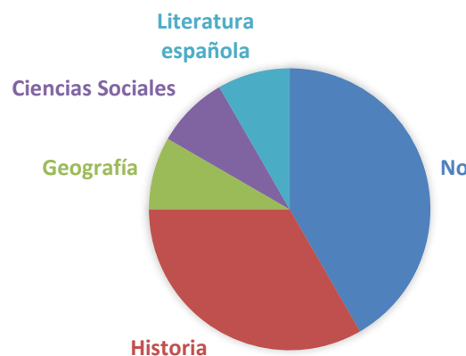
1. DURANTE TU CARRERA UNIVERSITARIA, ¿HAS CURSADO ALGUNA ASIGNATURA RELACIONADA CON EL PATRIMONIO CULTURAL? INDICA CUÁLES.

Por su parte, los resultados derivados de la primera categoría dedicada a la conceptualización y tipología patrimonial reflejan el predominio de criterios estéticos o artísticos a la hora de especificar los referentes patrimoniales, aunque en varias ocasiones se expone también desde perspectivas históricas y simbólico-identitarias. Las siguientes tablas demuestran la frecuencia textual de las respuestas 6,7, 8, 9 y 18.