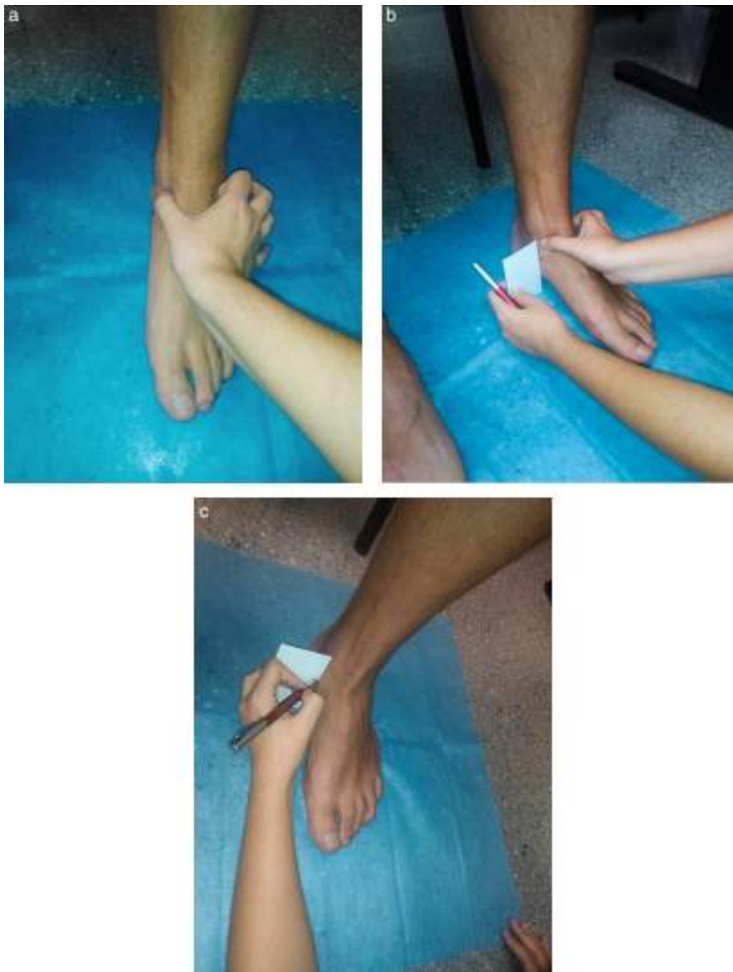
Figura 1 a) Medición del Navicular Drop Test : colocación de la articulación subastragalina en posición neutra y marcación del escafoides. b) Medición del Navicular Drop Test : marcación de la posición del escafoides con la articulación subastragalina neutra. c) Medición del Navicular Drop Test : marcación de la caída del escafoides en carga relajada.

En cuanto al FPI, se observó que un 63% de la muestra presentaba el pie derecho dentro del rango neutro en la medida previa a la actividad, y el 68% de los participantes presentaban esta medida en el pie izquierdo. Se encontraba dentro de la categoría «pronado» el 32% de la muestra en ambos pies, y un 5% presentaba el pie derecho altamente pronado previo a la actividad, frente al 0% del pie izquierdo. No hubo ningún resultado de pies supinados ni altamente supinados. La media de estas medidas en el periodo preactividad fue