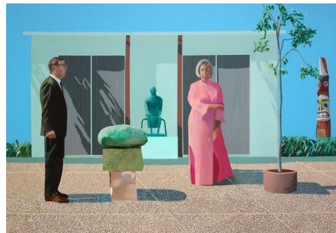
Fig. 15 David Hockney

David Hockney convierte sus deseos y sus pasiones en intensas zonas de color, que son captadas directamente por la mente y visión del espectador. El empleo de colores vivos y brillantes, abraza al público expectante, llamando su atención y de esta forma lo mantiene unido a la obra. De la misma forma, siempre deja patente su punto de vista,