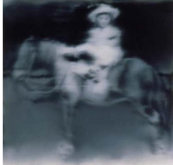
Fig.10. Gerhard Richter

El artista envuelve en su obra todo aquello que rodea al ser humano en su aspecto diario, como sucede con cada uno de los artistas nombrados en el trabajo, lo cotidiano es expresado por su sencillez, las acciones que perseguimos y encontramos a diario, que pasan por desapercibidas y en cambio a la hora de ser realizadas cobran el interés necesario que no le es otorgado en la realidad ya que dichas acciones no presenta valor alguno en nuestras vidas, sino que a veces, suceden y pasan de largo por nuestro existir.