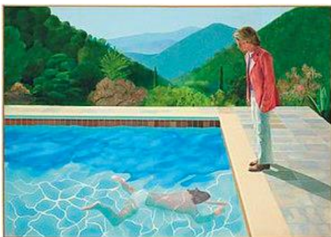
Fig. 14 David Hockney

El artista británico y multidisciplinar David Hockney es uno de los mayores referentes en el panorama actual. Su obra nos aporta un carácter rico, amplio y versátil. Podemos observar como muchos de los puntos de vistas plasmados por el autor, han sido ejecutados de una misma forma durante la labor artística, aspectos como los colores brillantes y las amplias zonas planas aportadas de la escuela pop, se han visto reflejadas en el trabajo. Además de ello; la mancha y el trazo libre, así como el claroscuro, la línea nítida y la perfección formal.