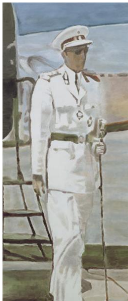
Fig.11 Luc Tuymans

En las pinturas de Luc Tuymans las ideas no se muestran de manera explícita, sino a través de escondidas alusiones y referencias indirectas. Las imágenes aparentemente inocuas pero cargadas de intensidad, generan desasosiego y perturban al espectador.