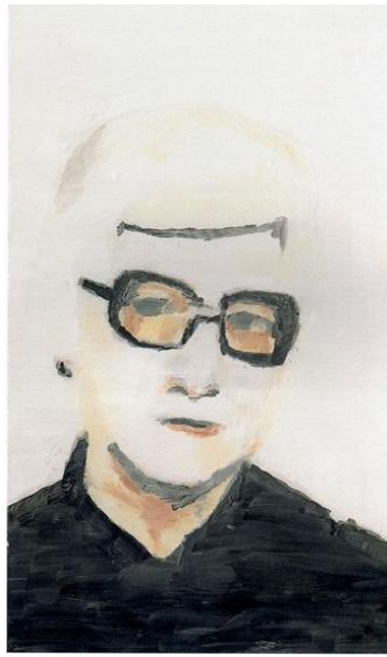
Fig.12 Luc Tuymans