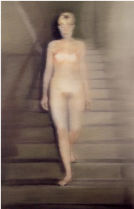
Fig.9. Gerhard Richter

ellas de gran valor pictórico. Las muestras figurativas del pintor, son muestra fidedigna del ambiente en el que desea representarlas y de esta forma ocasionar un espacio y tiempo ocupado, de vital importancia para la transmisión del mensaje artístico.