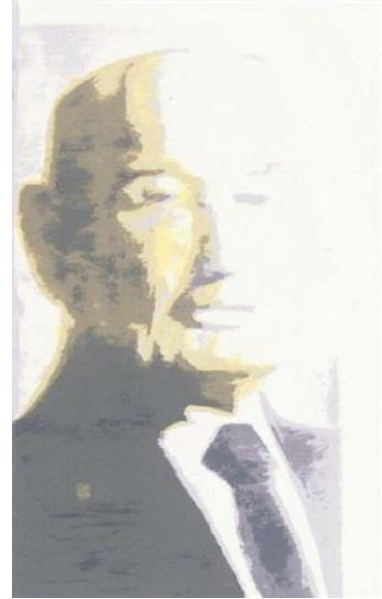
Fig.13 Luc Tuymans

El artista británico y multidisciplinar David Hockney es uno de los mayores referentes en el panorama actual. Su obra nos aporta un carácter rico, amplio y versátil. Podemos observar como muchos de los puntos de vistas plasmados por el autor, han sido ejecutados de una misma forma durante la labor artística, aspectos como los colores brillantes y las amplias zonas planas aportadas de la escuela pop, se han visto reflejadas en el trabajo. Además de ello; la mancha y el trazo libre, así como el claroscuro, la línea nítida y la perfección formal.