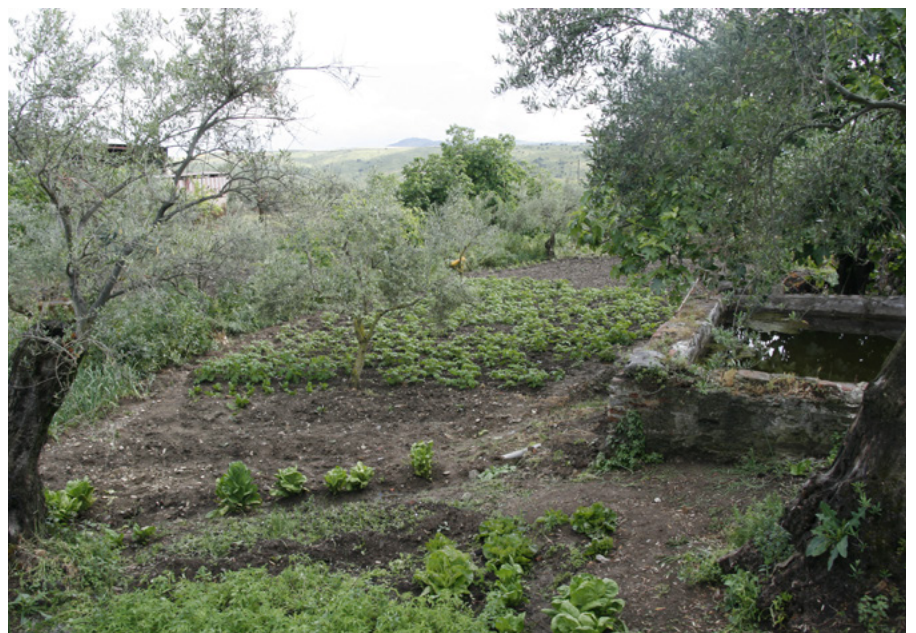
Huerta y alberca, cerca de El Charco