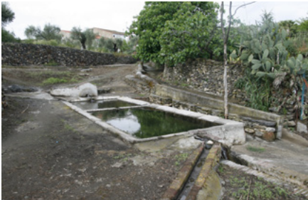
Fuente-lavadero El Charco

Como dijimos, el grupo motor de Activa Valverde es realmente reducido, en torno a unas diez personas que de manera continua están en el pueblo, participa activamente en las reuniones y está al tanto de todas las actividades, encuentros, reuniones y proyectos. Al ser dos de ellas parte de la corporación municipal, la interacción con el Ayuntamiento es continua. En la dinámica de este núcleo participa de manera directa y continua la Universidad, ya que dos de los profesores se desplazan habitualmente al pueblo y, sobre todo, están en continua relación telefónica y por redes sociales con la iniciativa, intercambiando información, haciendo circular noticias y proyectos, organizando y acompañando a reuniones, y redactando y concurriendo a proyectos. La elaboración de estrategias la toma de decisiones es conjunta, habida cuenta del altísimo grado de confianza mutua e implicación existente. En esta línea, y hasta el momento, las líneas estratégicas y proyectos que se plantean son los siguientes: