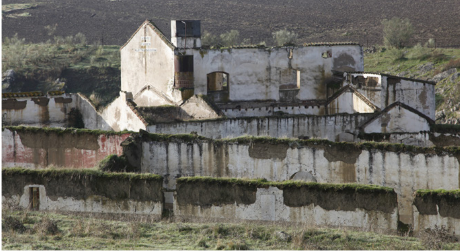
Fábrica electroharinera San Luis

ciones e inhibición de la iniciativa, el emprendimiento y la actitud crítica reivindicativa (ACOSTA-NARANJO, 2007).