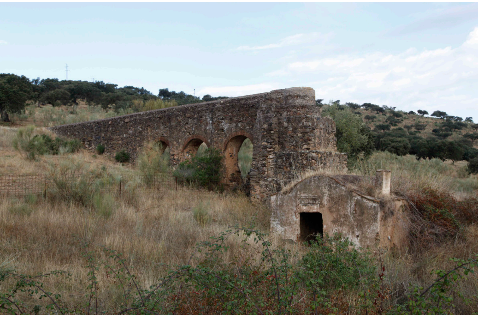
Molino del Najarrillo en Valverde de Burguillos (Badajoz)