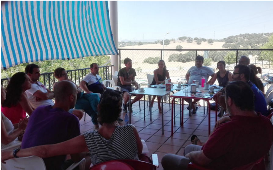
Reunión de Activa Valverde

futuro , en Sevilla; el II Foro pueblos en movimiento , en Benaluaría (Málaga); el foro Reto Demográfico de Extremadura , en Caminomorisco (Cáceres); Las Jornadas sobre cultura tradicional y despoblación , en Segovia; y las III Jornadas Valdejalón por la educación , en Valdejalón (Zaragoza).