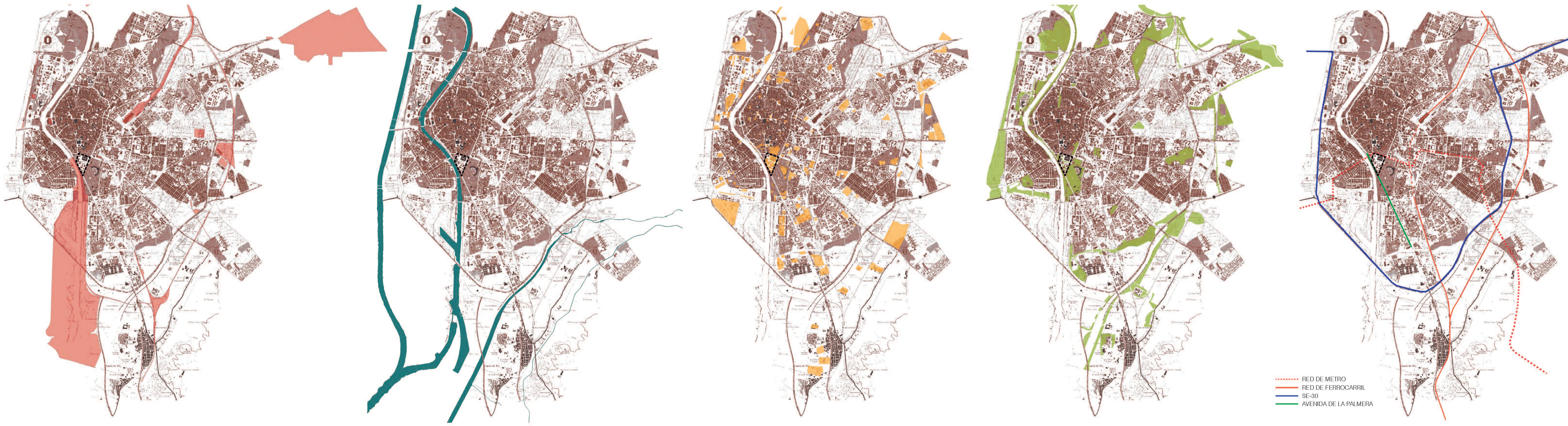
SISTEMA DE TRANSPORTES E INFRAESTRUCTURAS