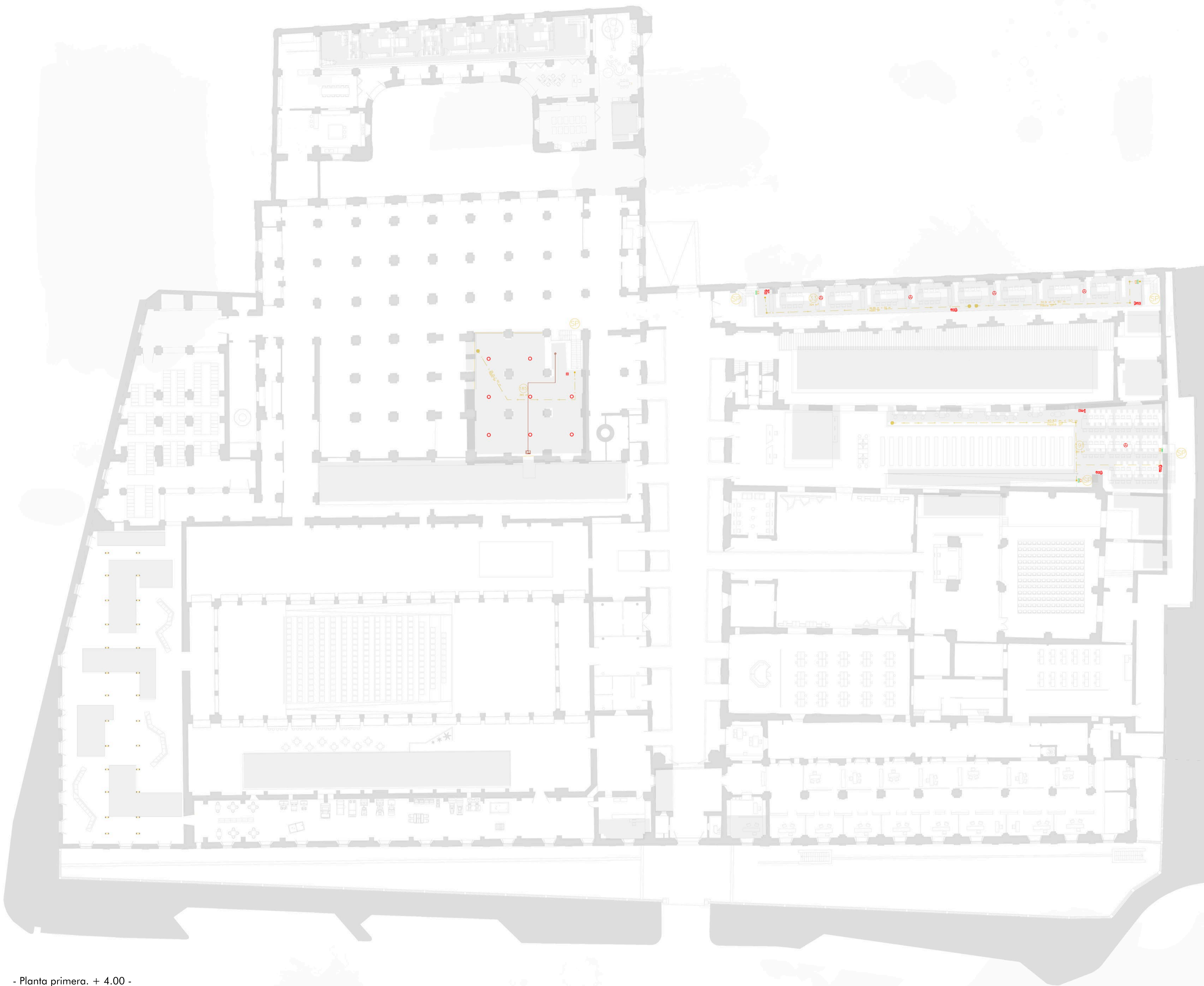
- Planta primera. + 4.00 -