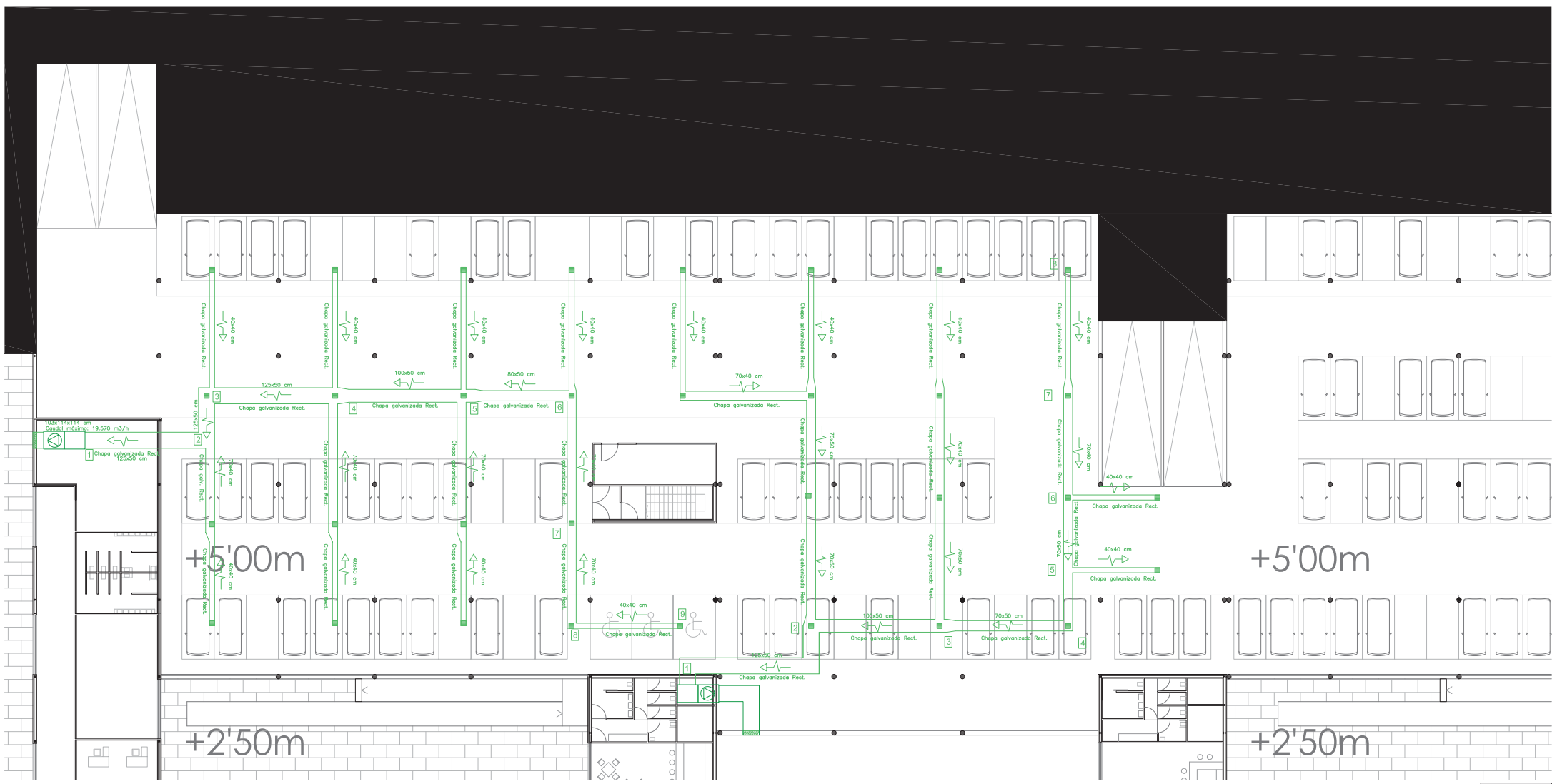
PLANTA BOTANO, ESCALA 1:100