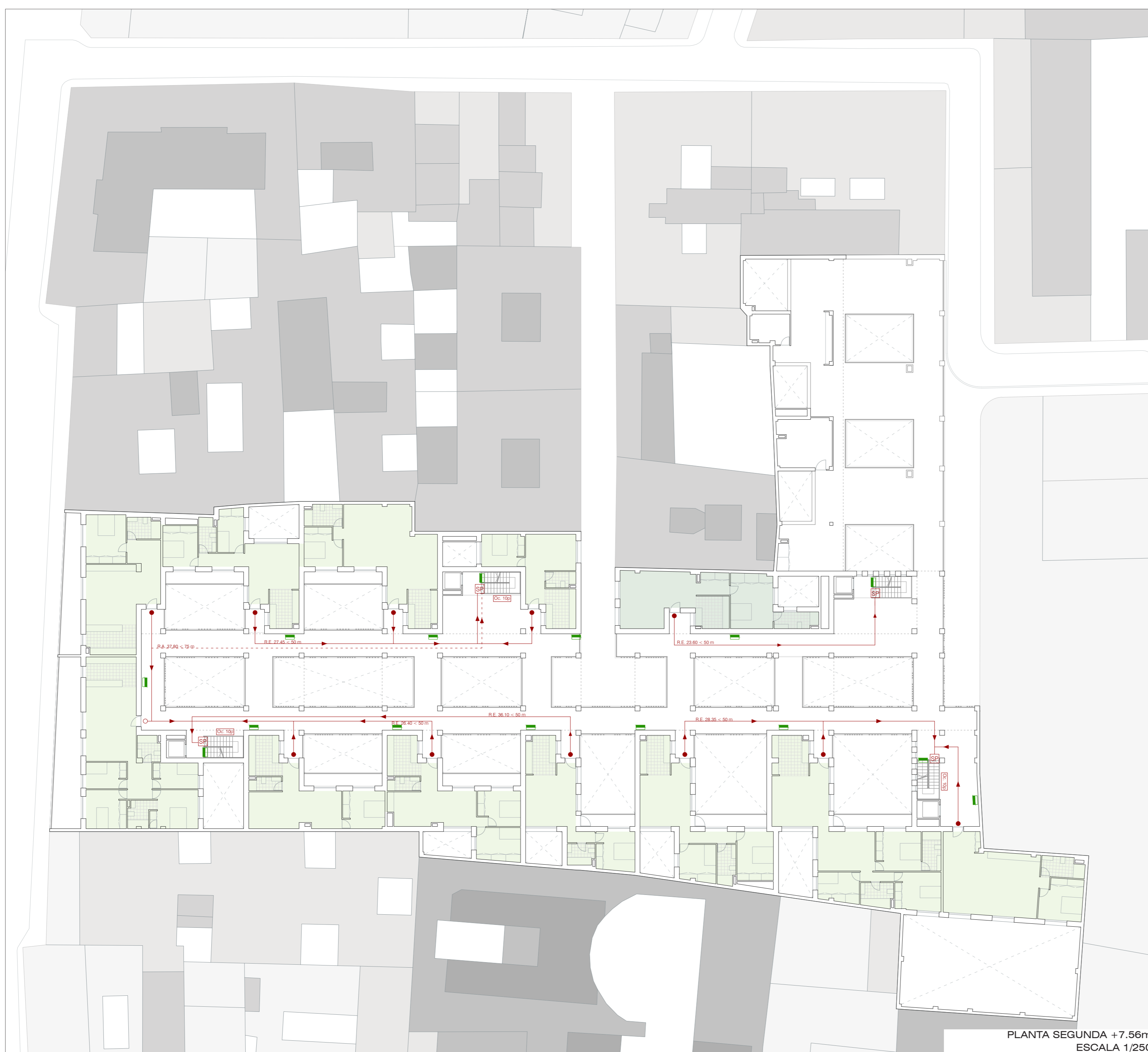
PLANTA SEGUNDA +7.56m ESCALA 1/250