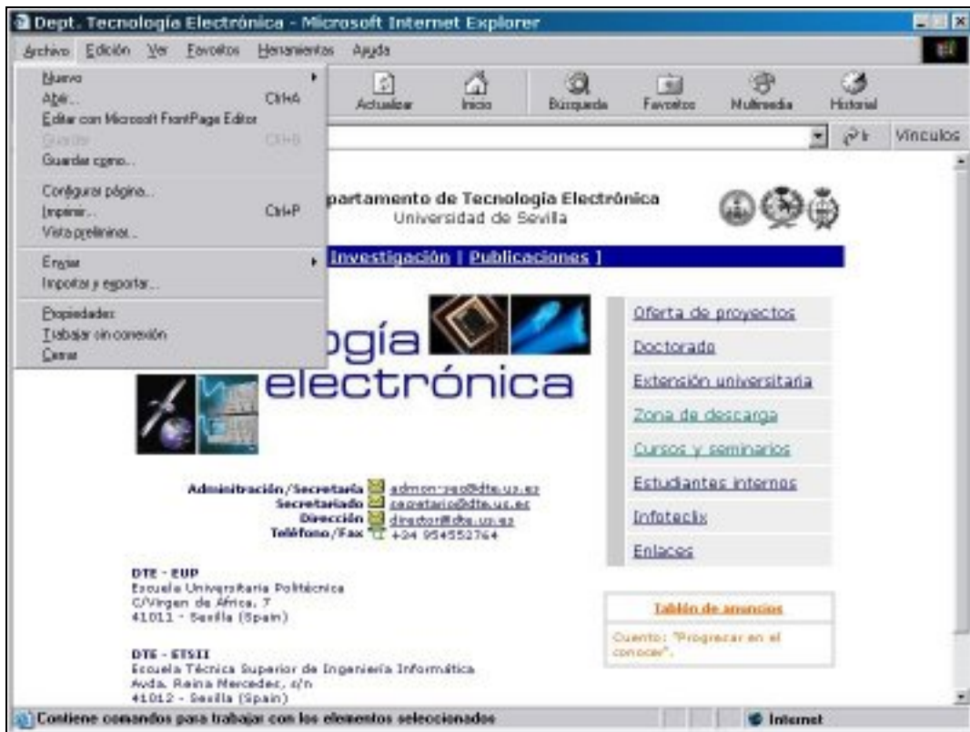
Fig. 2.a. Microsoft Internet Explorer 6.0 falsificado mediante JavaScript a una resolución de 800x600.