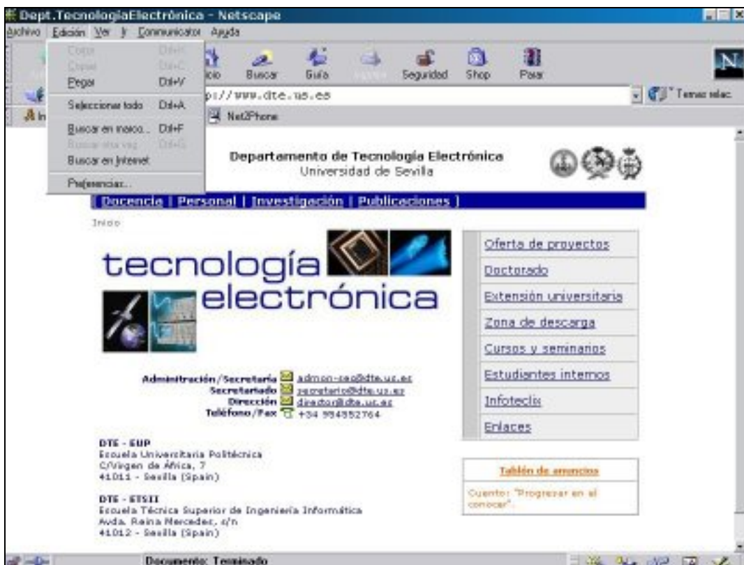
Fig. 2.b. Netscape Navigator 4.78 falsificado mediante JavaScript a una resolución de 800x600.