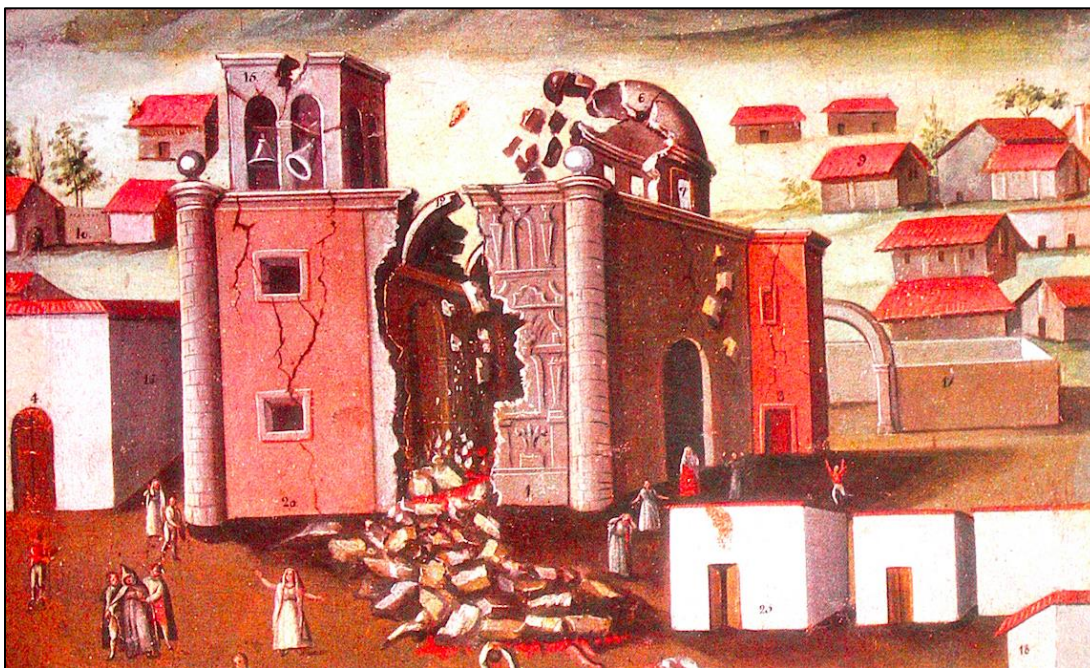
Figura 4. Fragmento de la pintura Crónica del temblor de "La Encarnación" . 67

En la pintura es notable el colapso parcial de la mayor parte de la bóveda central del templo y la fachada. Bajo enormes bloques de escombros quedaron los cuerpos mutilados de los fallecidos, tanto fuera como dentro del edificio. La imagen muestra una representación del drama atestado en 1806 por los zapotlenses. Aunque la pintura es una representación elaborada con una intencionalidad narrativa, pues el autor lo denominó "crónica", aporta una idea bastante realista, coherente con lo expuesto en este artículo con los testimonios documentados del sacerdote Francisco Núñez, los subdelegados Diego de Zárate y Vicente Velázquez, y la ratificación del juramento a San José, como Santo Patrono de los Temblores. En conjunto, los relatos y la representación pictórica mejoran la comprensión de este suceso sísmico y desastroso, poco estudiado, y que aún requiere un estudio más amplio de toda el área afectada.