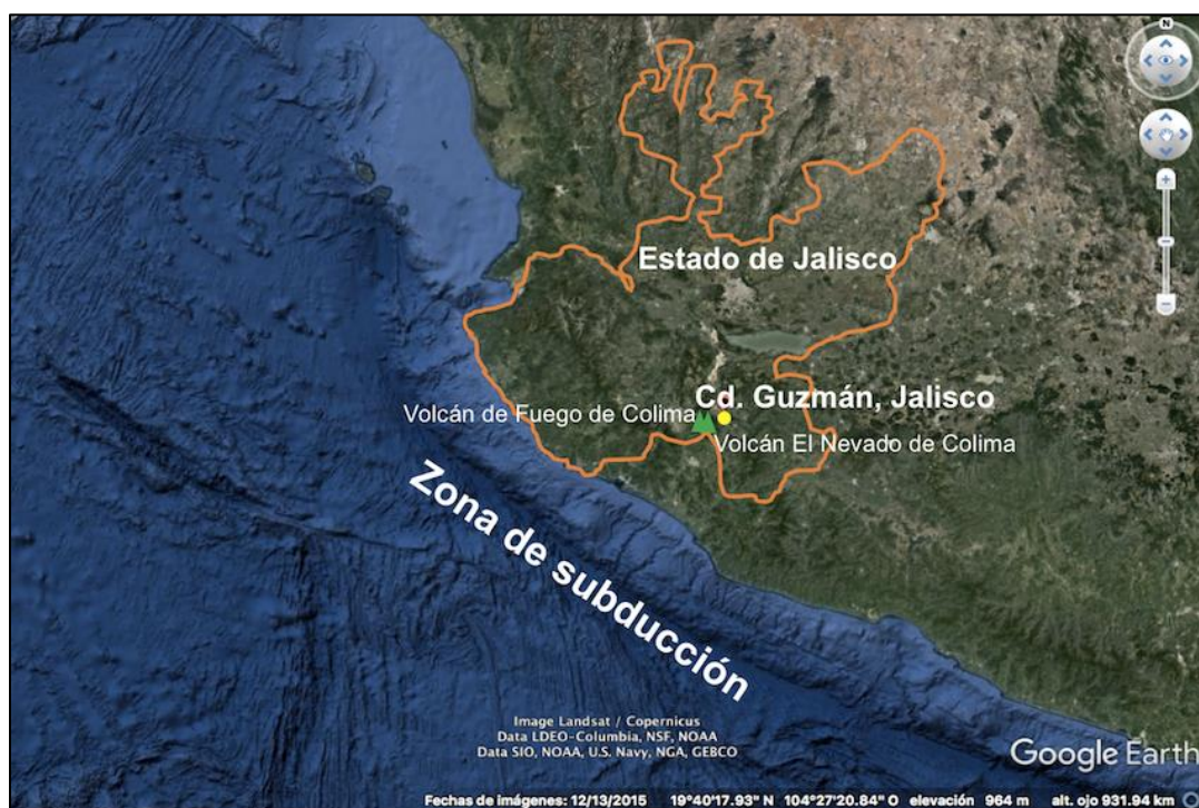
Figura 1. Ubicación de Zapotlán El Grande (hoy Ciudad Guzmán). 27

El terremoto tuvo una magnitud estimada de 8.2 y fue registrado en diversas localidades. 28 De acuerdo con una escala de 0 a 12, el evento presentó intensidad 8 en Zapotlán, Guadalajara, Gómez Farías y Cocula; 7 en Colima, Autlán, Copala, Sayula, Tolimán, Tamazula y Tuxpan; 6 en San Blas y 5 en Amacueca (figura 2). El sismo también fue percibido en Morelia, 29 Puebla, Veracruz, Oaxaca y la Ciudad de México. 30