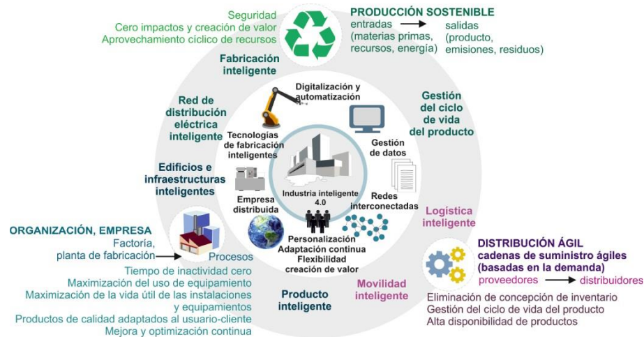
Figura 28: Industria 4.0: contextos para industrias inteligentes.

fabricación. Esta situación está ligada a la gestión de la complejidad: el elevado número de estrategias, actividades, procesos, información y datos, la multi-dimensionalidad de los parámetros de control y los requerimientos de rendimiento a tener en cuenta, hacen que la integración equilibrada de las tres dimensiones sostenibles (economía, ecología y equidad) no sea todavía viable ni técnica ni económicamente. Los sistemas de fabricación fractales son una solución para esta situación.