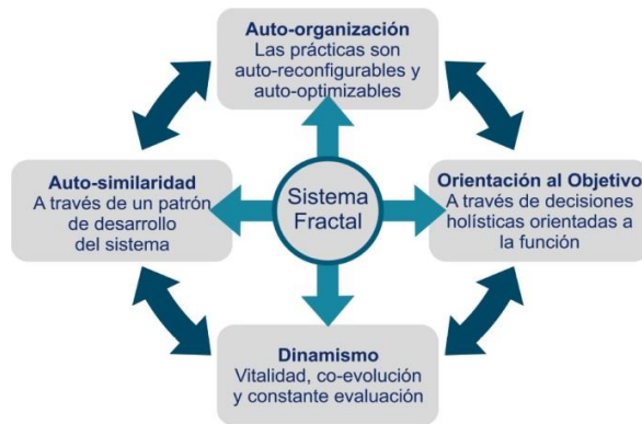
Figura 30: Principios de organización fractal.

Uno de los principales objetivos será la implementación real de los resultados en un entorno productivo aeronáutico con sedes en España, Francia y Alemania. Se tendrán en cuenta para ello las últimas tecnologías del sector, técnicas de implementación y el actual estado del arte: