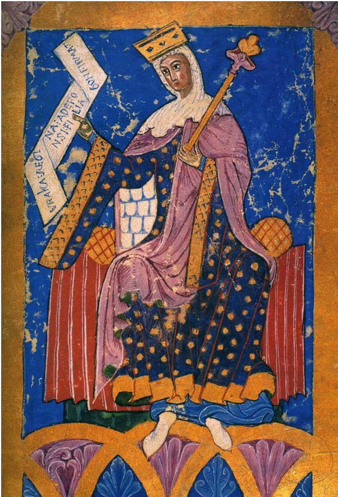
Ilustración. La reina Urraca I, Tumbo A de la catedral de Santiago de Compostela.