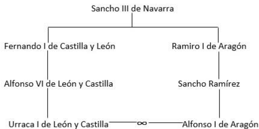
Figura 3. Árbol genealógico de los reyes Urraca I y Alfonso I.

sí, y aunque al principio hubo partidarios en el reino León a favor del matrimonio y del pretendiente leonés, finalmente la situación se hizo insostenible acabando en una guerra entre ambos reinos, que se explica a continuación.