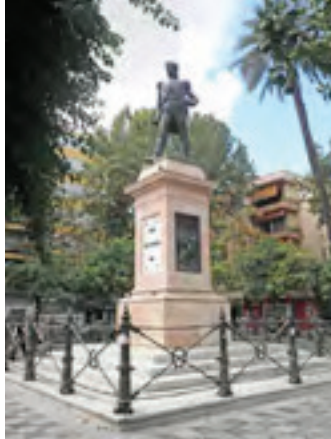
Monumento a Daoíz. Sevilla

5. ¿Por qué se representa la muerte de forma tranquilizadora? Enumera los elementos decorativos que se han empleado para decorar la verja.