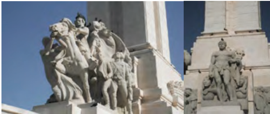
Detalles del Monumento a las Cortes. Ciudadanía y Hércules