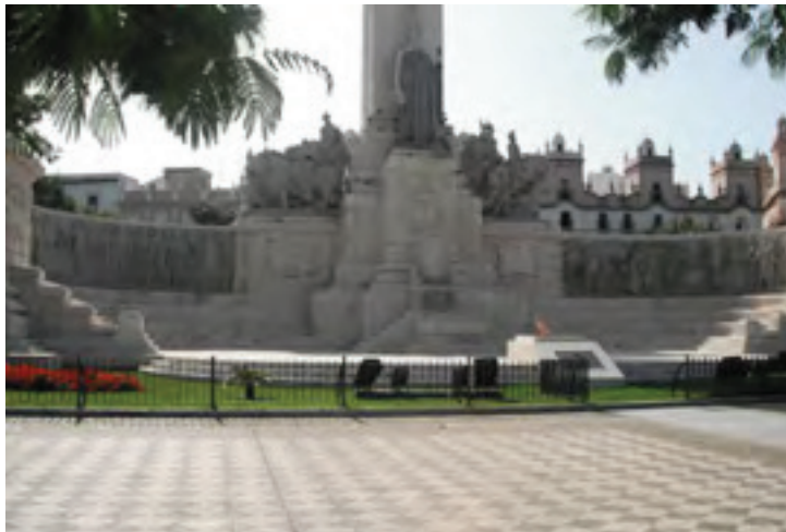
Monumento a las Cortes de Cádiz. Detalle frontal.