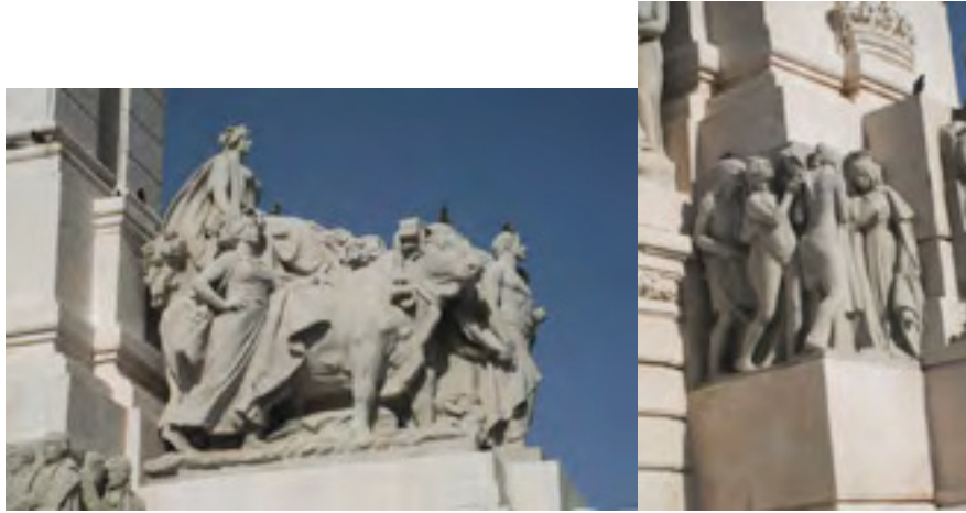
Detalles del monumento a las Cortes. Agricultura y América.

flanqueado por dos leones y columnas (escudo de Cádiz). A la derecha de Hércules, un altorrelieve simboliza América por medio de un grupo de personajes Colón ofreciendo sus presentes a la reina Isabel la Católica por mediación de los indios que trajo consigo. El otro grupo escultórico situado a la izquierda de Hércules simboliza la ciudad de Cádiz por medio de un grupo de diputados vestidos a la usanza de la época. 201