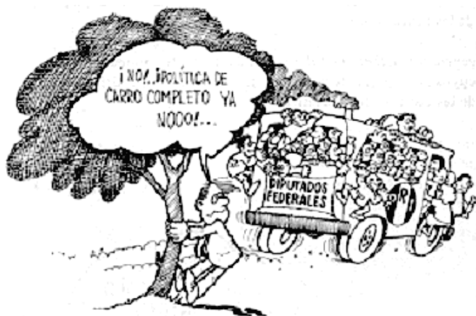
Ilustración de José Duarte en Prawda , 1987.

A pesar de todo lo anterior, López Portillo necesitaba no dejar de voltear al pueblo y en este sentido inició la reforma política que permitió por primera vez en el país (en 1982 al término de su mandato) que contendieran a la silla presidencial nueve partidos y siete candidatos. De cualquier forma el sistema no estaba dispuesto a moverse un ápice para repartir el poder, la sombra del fraude electoral apareció y el PRI ganó 299 de los 300 distritos electorales.