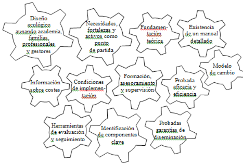
Figura 3. Criterios de calidad de los programas de parentalidad positiva basados en evidencias.

los programas basados en evidencias, a continuación se presentan algunas de las iniciativas más recientes en esta línea dirigidas a promover la parentalidad positiva desarrolladas en la Comunidad Autónoma de Andalucía.