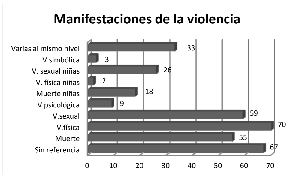
Figura 1. Manifestaciones de violencia recogidas en El País y El Mundo en los años 2000, 2004, 2008 15 .