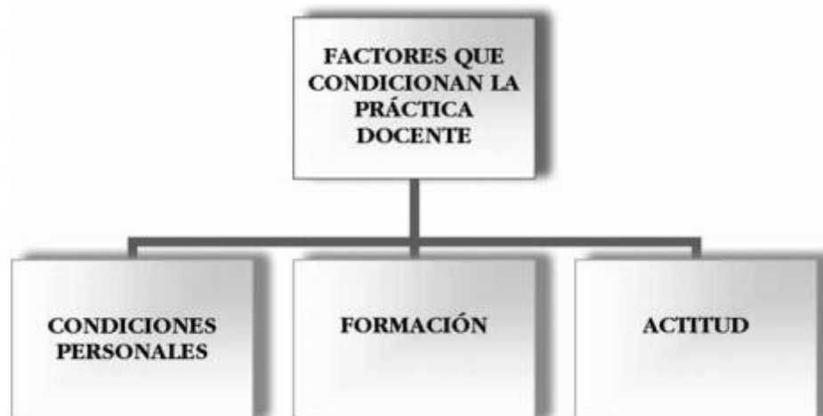
Figura 2.2. Factores que condicionan la práctica docente (Prieto Jiménez, 2008)

Sin embargo, según Prieto Jiménez (2008) el maestro/a es una de la figura esencial en la educación y en la formación del niño. Y señala que la práctica docente está condicionada por tres factores: