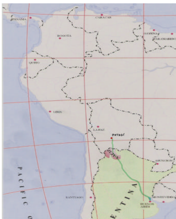
ILUSTRACION 2: Itinerario seguido por José Salinas desde Buenos Aires hasta la villa de Potosí para la venta de los esclavos

enviarán bien acondicionada, procurando sea muy poca o ninguna blanca por ser mejor la colorada.