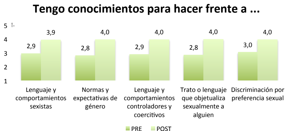
Gráfico 2. Respuestas medias a las preguntas sobre ¿en qué grado estás de acuerdo con la afirmación “tengo conocimientos para hacer frente a estos elementos”? Respuestas de los cuestionarios pre (conocimientos previos)