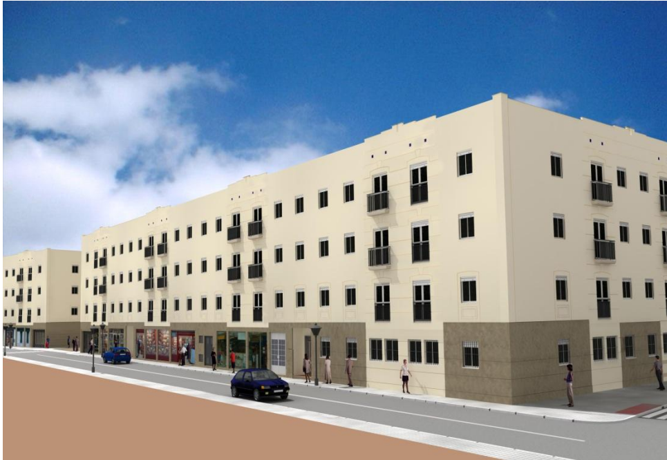
Figura 1: Tipología de edificio residencial analizado

Como hipótesis inicial de la investigación, se consideró que en el territorio de estudio la única actividad que ejercía algún impacto sobre el mismo es la que correspondía a la construcción de los bloques de edificios considerados. Y ese impacto sería ejercido durante un período de 12 meses, que es el que se considera necesario para la ejecución de la obra. En el caso de que el período de ejecución se alargara más allá del año planteado, habría que asumir que el impacto o el consumo derivado del proceso edificatorio sería uniforme. Así, si la duración de la obra fuera de 18 meses, tendría un impacto sobre el territorio distribuido en el tiempo de la siguiente forma: durante el primer año se produciría 2/3 del impacto total de la obra y durante el segundo año se produciría 1/3 del impacto total de la obra. Considerar como hipótesis de partida la duración de la obra es necesario también para poder realizar determinados cálculos de impacto, ya que al efectuar el análisis en la fase de diseño del edificio los datos reales de consumo de recursos (agua, electricidad...) necesarios para la ejecución de la obra no estarán disponibles. Además, la metodología de cálculo tendrá siempre un carácter predictivo, por lo que dicha hipótesis estaría suficientemente justificada.