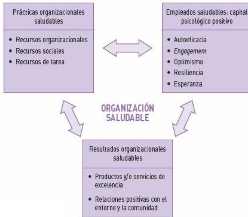
Figura 2. Modelo de organización saludable. Fuente: Salanova (2009b)

La Psicología Organizacional Positiva se ha definido como el estudio científico del funcionamiento óptimo de las personas y de los grupos en las organizaciones, así como su gestión efectiva. Se trata de una aproximación positiva, más novedosa y emergente, que se centra en las fortalezas del empleado y del funcionamiento organizacional óptimo. Como afirma Salanova (2009a), en las organizaciones se debe optimizar no sólo el capital humano sino también el capital psicológico y tener en cuenta y valorar las fortalezas personales y capacidades psicológicas de los trabajadores como un activo más de la empresa. Por capital psicológico se entiende al conjunto de características positivas que desplegamos en nuestra vida profesional, que puestas al servicio de los contextos de trabajo, pueden marcar una diferencia en los resultados que se consiguen. Estas características, identificadas por Luthans y Youssef (2004) son: la autoeficacia (confianza en la propia capacidad para lograr un objetivo específico en una situación específica), la esperanza (motivación orientada al cumplimiento de un objetivo), optimismo realista (confianza en la resolución positiva de acontecimientos futuros) y resiliencia (capacidad de afrontar sostenidamente condiciones