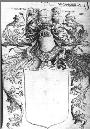
FIG 1: Imagen de una cimera adornada con empresa y mote. Gonzalo Fernández de Oviedo, Batallas y quincuagenas , Madrid, Real Academia de la Historia, 2000, tomo II, p. 128.