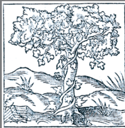
FIG 6: Guillaume de La Perrière, Le théâtre des bons engins , Paris, Denis Janot, n.d. [1544], emblema 82.