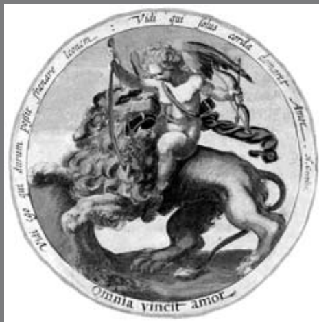
FIG 3: Daniël Heinsius, Quaeris quid sit Amor , s.l., c. 1601, emblema 1.