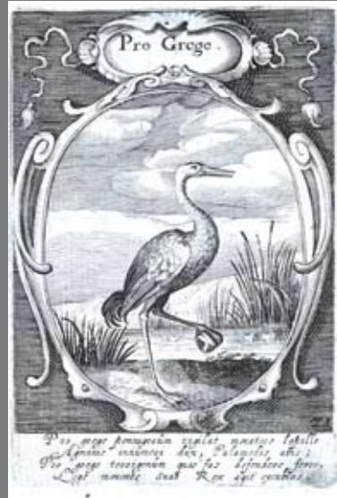
FIG 5: Peter Isselburg, Emblemata Politica: In aula magna Curiae Noribergensis depicta; Quae sacra Virtutum suggerunt Monita Prudenter administrandi Fortiterque defendendi Rempublicam , [Nürnberg], Isselburg, [1617].