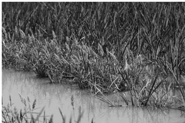
Figura 6. Parcela con P. monspeliensis durante el cultivo.

Los adultos resultantes de esta cuarta generación tenderán a permanecer en la misma parcela si disponen de un huésped apropiado, sea P. monspeliensis o las propias plantas de arroz. De no ser así se producirá un nuevo desplazamiento de adultos en busca de otra parcela de arroz ya que una vez iniciada la floración de éste, se convierte en el principal huésped. Sobre él se desarrollará la quinta y última generación, habitualmente en las parcelas de floración más temprana, lo que a menudo se corresponde con variedades de grano redondo.