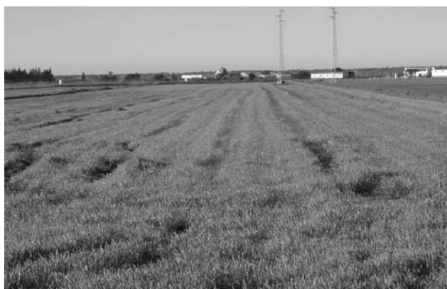
Figura 2. Parcela con P. monspeliensis a la salida del invierno.