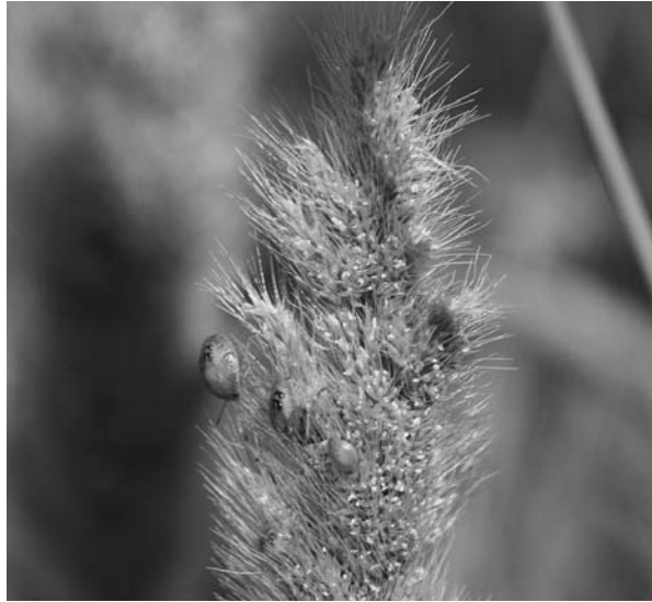
Figura 3. Estados ninfales de E. ventralis en P. monspeliensis .

La primera generación se desarrolla por tanto en P. monspeliensis alcanzando el estado de ninfas medianas a primeros de abril y apareciendo los nuevos adultos a mediados de ese mismo mes (Figuras 3 y 4).