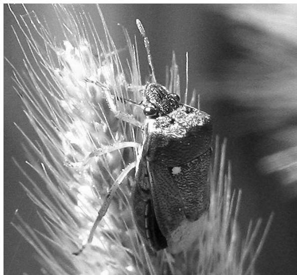
Figura 4. Adulto de E. ventralis en P. monspeliensis .